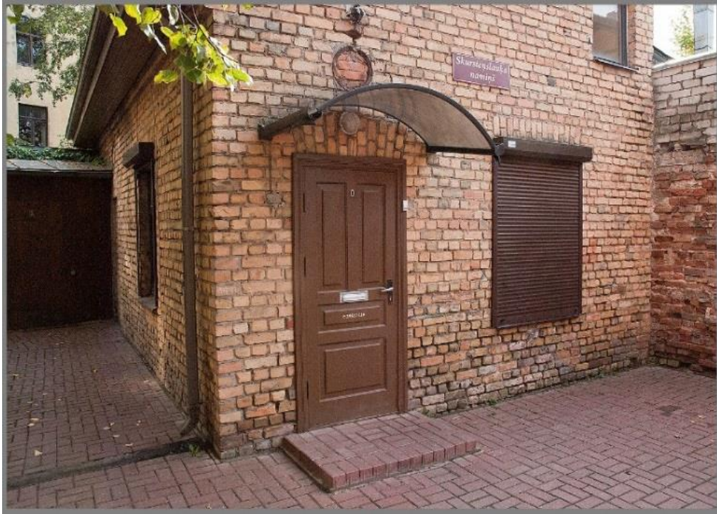
“Skursteņslaucītāju namiņš”, Mūrnieku ielā 1

Skursteņslaucītāju figūriņas ,dažādi kausiņi un, protams, romantiskās pastkartes ,ne velti skursteņslauķi uzskata par laimes nesēju, tam nevar nepiekrīst .Gadumija ir brīnumu laiks .Lai skursteņslauķim pietiek laimes, ko dāvāt ikvienam no mums. Senajās Ziemassvētku un Jaungada apsveikumu atklātnēs skursteņslauķis redzams kopā ar citiem laimes un pārticības simboliem kā cūka un četrlapu āboliņa lapiņa.