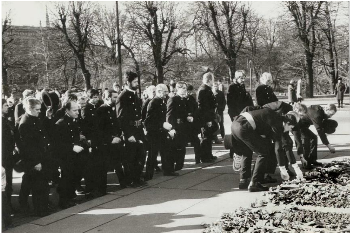
1988.gadā no Ģildes, tobrīd pa V.Ļeņina ielu (tagad Brīvības iela) pasākuma dalībnieki devās pie Brīvības pieminekļa un svinīgi nolika ziedus.