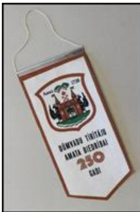
Vimpelis izgatavots, atzīmējot dūmvadu tīrītāju amata biedrības 250. gadadienu.

Ar vērienu 1988.gadā tika atzīmēta amata 250 gadu jubileja.