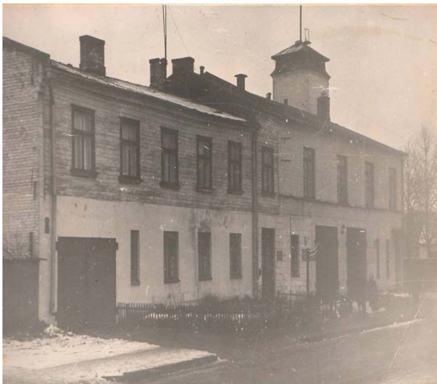
Šreienbušas BUB ēka Čiekurkalna 1.garā līnijā 6/8

Rīgas 6.Atsevišķā militarizētā ugunsdzēsības komanda (AMUK) tika nodibināta 1944.gada 13.oktobrī. Par pamatu komandas izveidošanai kalpoja Šreienbušas brīvprātīgo ugunsdzēsēju biedrība (dibināta 1900.gada 27.septembrī), kas atradās Čiekurkalna 1.garā līnijā 6/8.