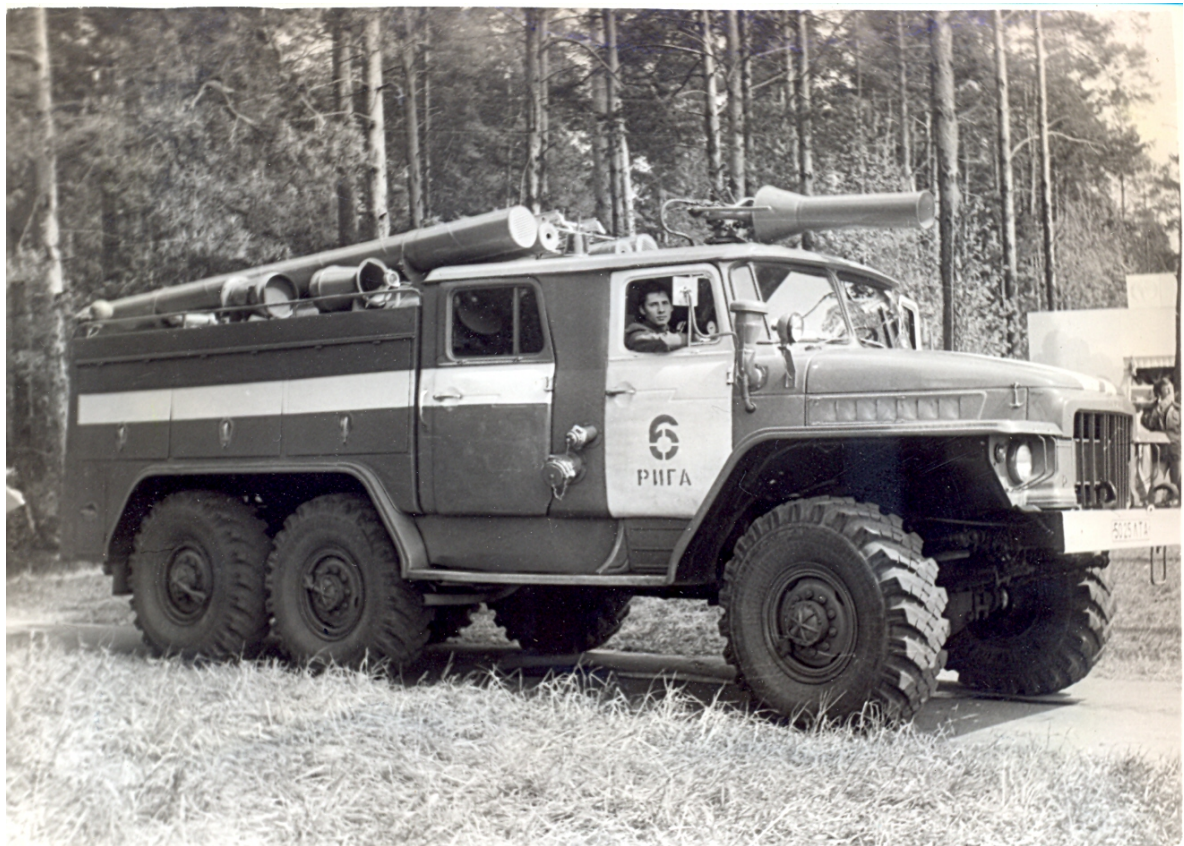
Skolēnu dziesmu un deju svētkos 1982.gadā.

6.Atsevišķā militarizētā ugunsdzēsības komanda tika izvietota ēkā Čiekurkalna 1.garajā līnijā 6/8. Viena no ēkām bija 1900. gadā būvētā divstāvu koka celtne, otra – 1936.gadā būvēta divstāvu mūra celtne (skat. foto apakšā).