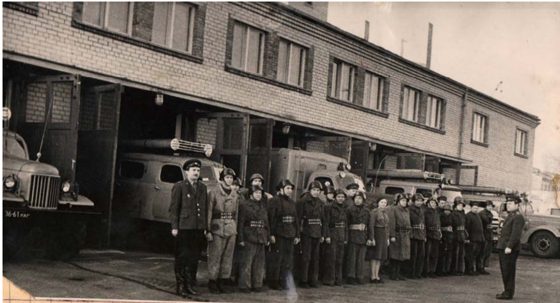
6. PMUD 1.un 2.sardzes maiņa 1966.gada maijā