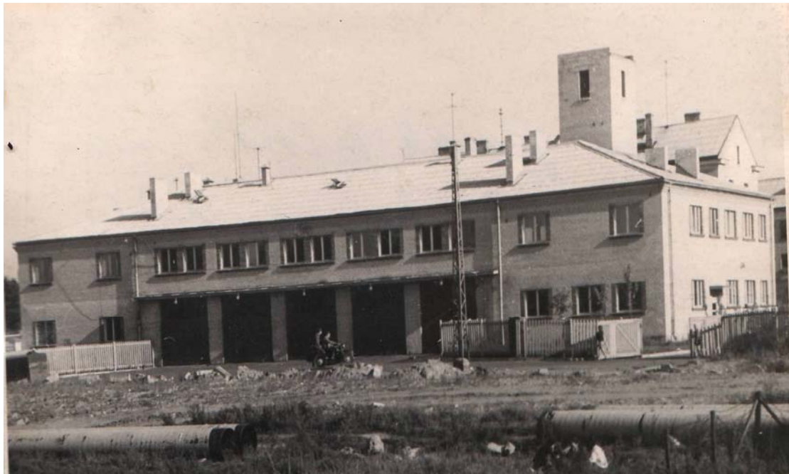
Struktūrvienības ēka Vijciema ielā 1, Rīgā, 1964. gadā

Laika posmā no 1961. līdz 1964. gadam tika projektēta un uzcelta jauna ugunsdzēsēju depo ēka, kurā izvietojās Rīgas Proletāriešu rajona Pastāvīgā militarizētā ugunsdzēsēju daļa. Daļas personālsastāvs aktīvi piedalījās kā celtniecības darbos, tā arī teritorijas labiekārtošanā. 1964. gada septembrī 6. PMUD pilnībā pārcēlās uz jauno divstāvu ēku Vijciema ielā 1. Ugunsdzēsēju depo ēka Čiekurkalnā tika nodota BUB rīcībā.