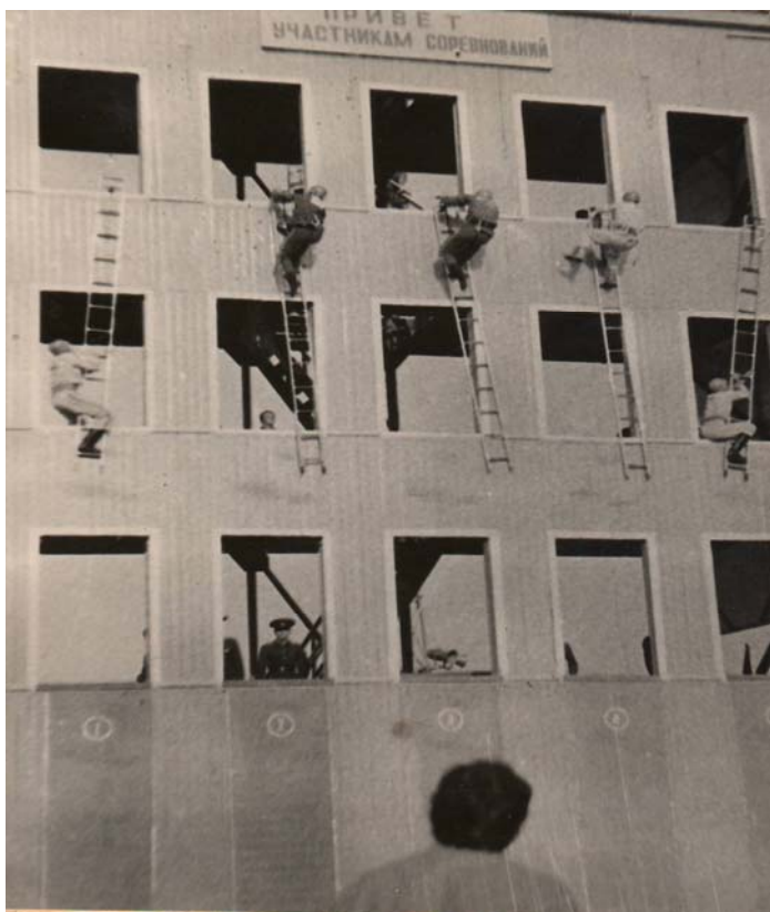
1950. gadā 6. AMUK ieņēma godalgoto 2. vietu ugunsdzēsības sporta sacensībās.

1956. gadā 6. AMUK kolektīvs ieņēma 3. vietu dienesta darbības vērtējumā un saņēma Latvijas PSR IeM goda rakstu. Normatīvu izpildē ugunsdzēsības ierindas mācībā 1981. gadā 6. PMUK komanda bija pirmajā vietā (skat. foto apakšā)