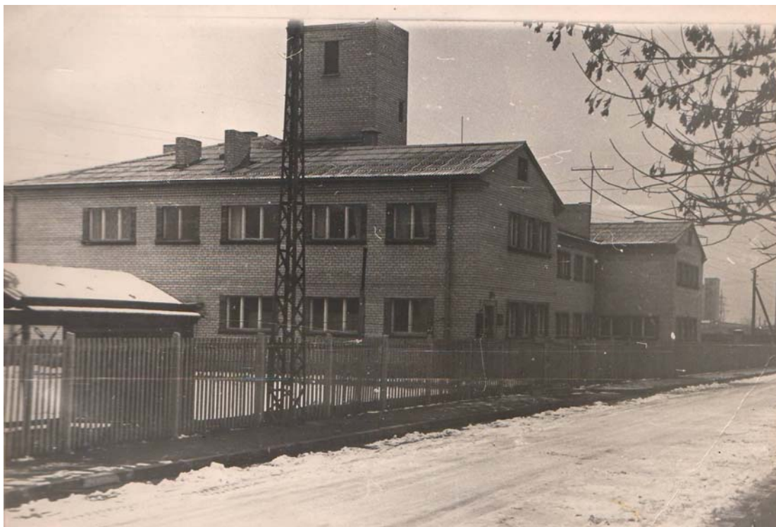
Struktūrvienības ēka Vijciema ielā 1, Rīgā, 1964. gadā