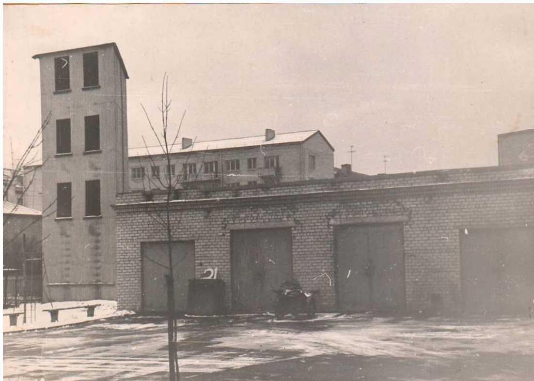
Saimniecības ēka ar mācību torni, 1966.g.

Turpmākajos gados ar daļas personālsastāva spēkiem ēkas dienesta telpās un teritorijā tika veikti rekonstrukcijas darbi, kā arī uzceltas papildus saimniecības un palīgtelpas: