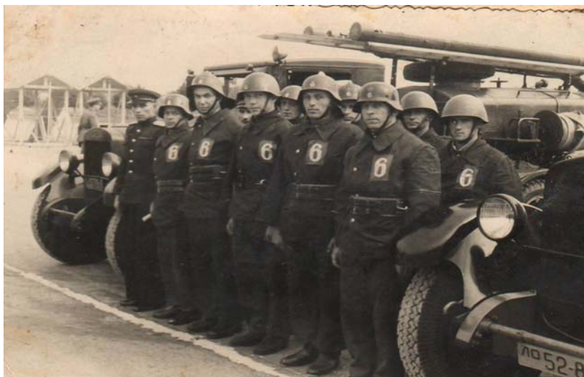
6. Atsevišķās militarizētās ugunsdzēsības komandas izlase garnizona sporta sacensībās ugunsdzēsības lietišķajā sportā 1949. gadā.