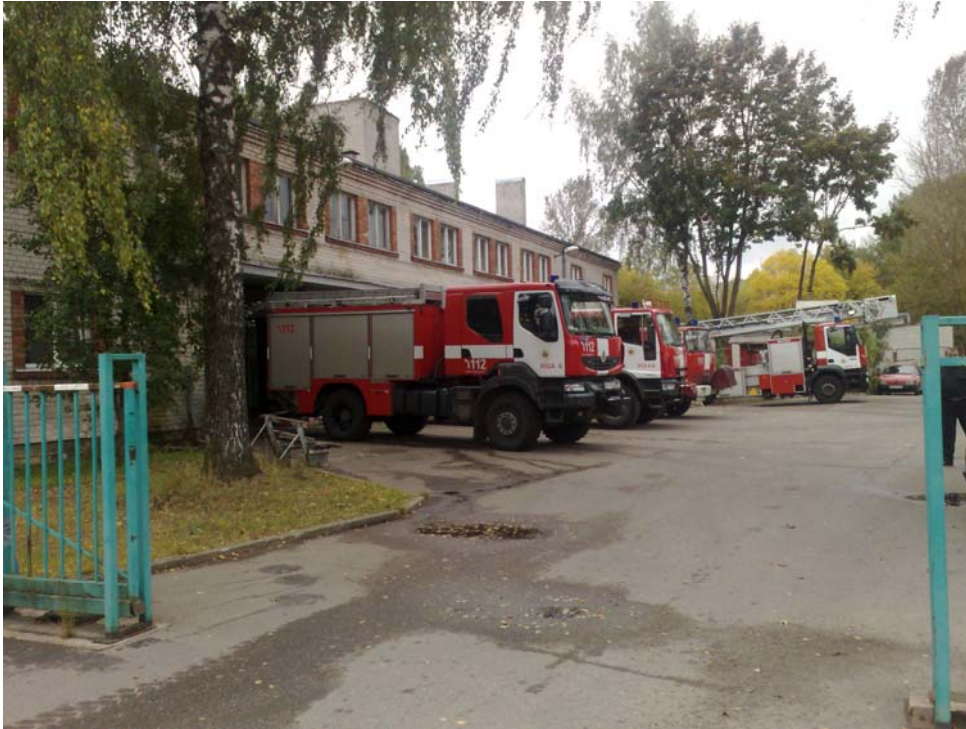
VUGD Rīgas reģiona pārvaldes 6.daļa Vijciema ielā 1, Rīgā, 2012.g.