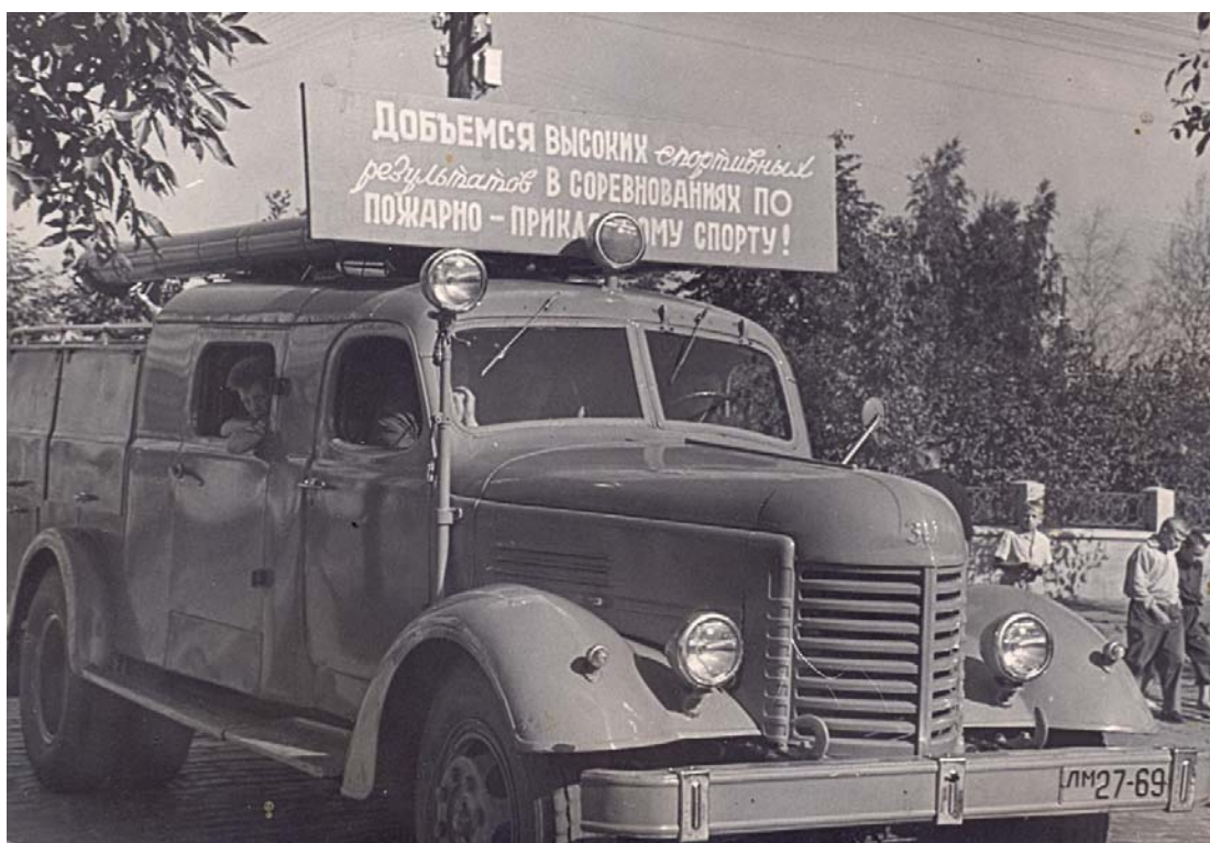
Ugunsdzēsības automobilis ZIL, 1950-tie gadi