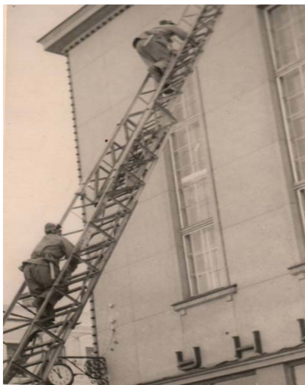
6. Atsevišķās militarizētās ugunsdzēsības komandas personālsastāvs ugunsdzēsības taktikas nodarbībās Universālveikalā „Centrs” 1956. gadā – cilvēku glābšana ugunsgrēkā.

Ugunsdzēsēju kaujas prasme ar katru gadu pieauga. To veicināja ne vien praktiskais darbs ugunsgrēku dzēšanā, bet arī ikdienas mācības. Vislielākā uzmanība tika pievērsta ugunsdzēsības taktikas nodarbībām un fiziskajai sagatavotībai.