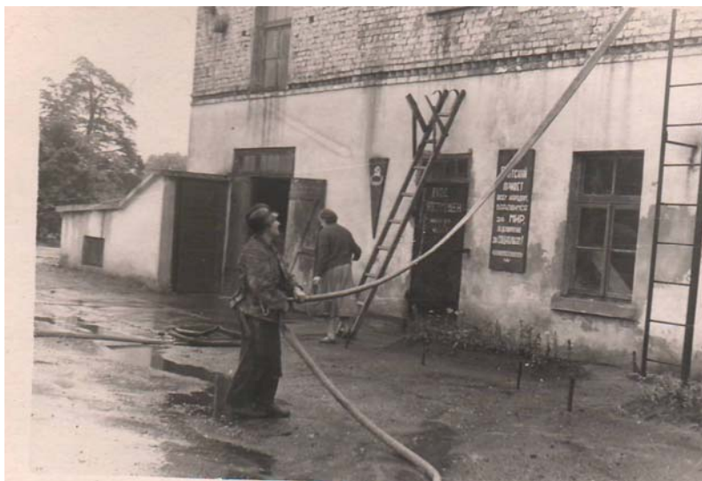
6.Atsevišķās militarizētās ugunsdzēsības komandas sastāvs ugunsdzēsības taktikas nodarbībās 1956.gadā.

Jau no pirmajām dienām ugunsdzēsēju komandas personālsastāvs iesaistījās ugunsgrēku likvidēšanā, kas katru dienu izcēlās Vecrīgā no armiju atstāto mīnu un artilērijas šāviņu eksplozijām.