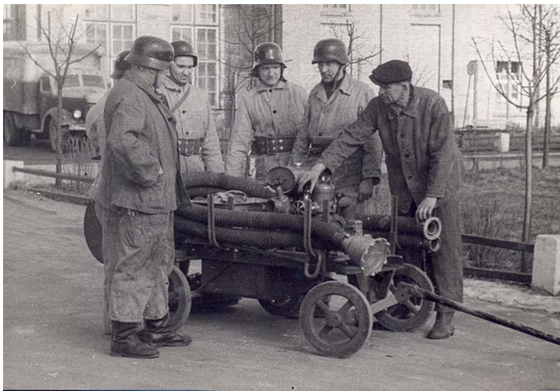
Viens no motorsūkņiem, 1950-tie gadi

Šreienbušas brīvprātīgo ugunsdzēsēju biedrība bija paglābusi no izvešanas uz Vāciju ievērojamu daļu ugunsdzēsības tehnikas un aprīkojuma. Aprīkojums uz to brīdi sastāvēja no ugunsdzēsības automobiļa, trijiem ugunsdzēsības motorsūkņiem, liela daudzuma ugunsdzēsības šļūteņu, stobru un cita ugunsdzēsības inventāra.