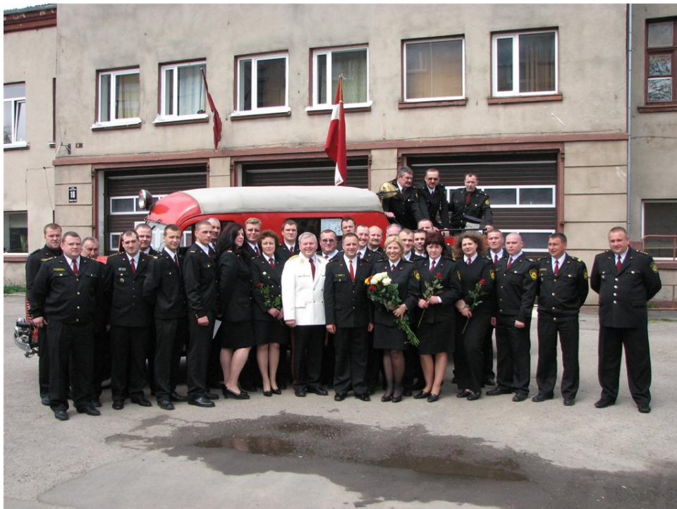
17.05.2010. Ugunsdzēsēju diena