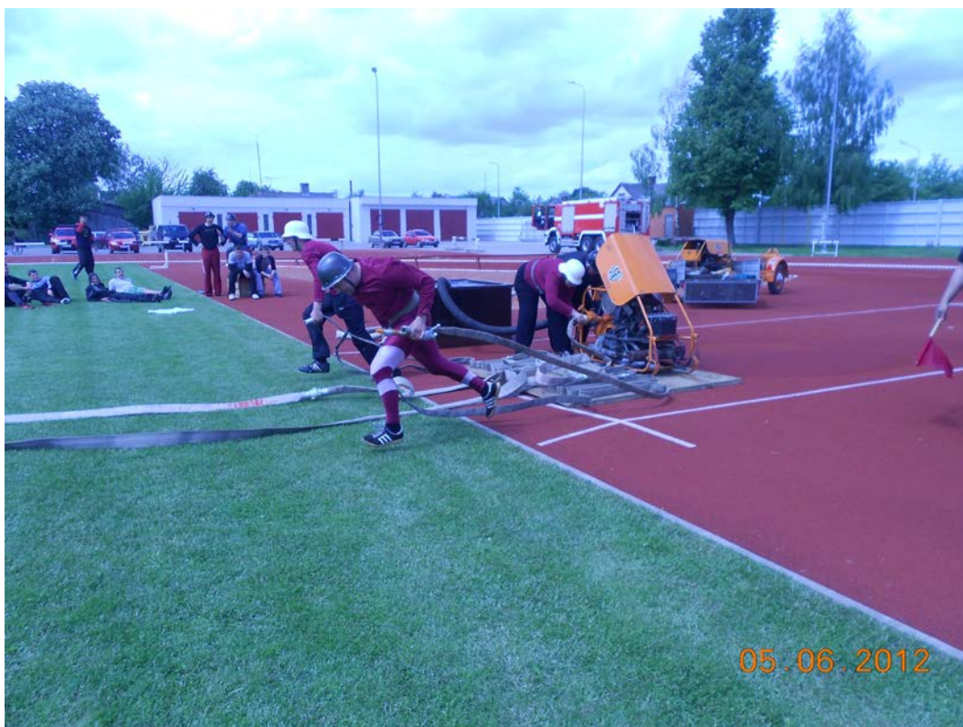
05.06.2012. Zemgales reģiona brigādes komanda. Starts.