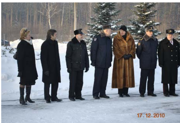
Svinīgā uzruna projekta noslēgums

Abu valstu amatpersonas uzrunāja projekta dalībniekus, prezentēja ugunsdzēsības un glābšanas tehniku un projekta ieviešanas gaitu.