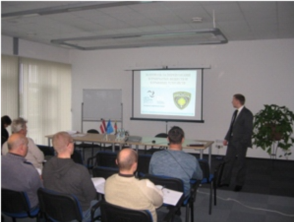
Seminārs Jelgavā.