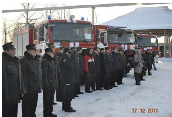
Projekta noslēguma pasākums