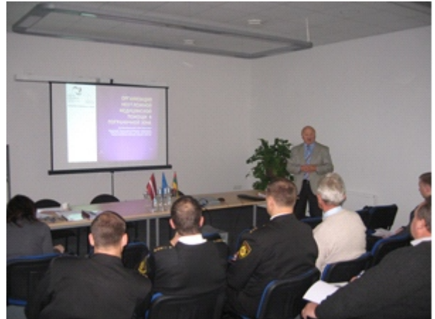
Seminārs Jelgavā.