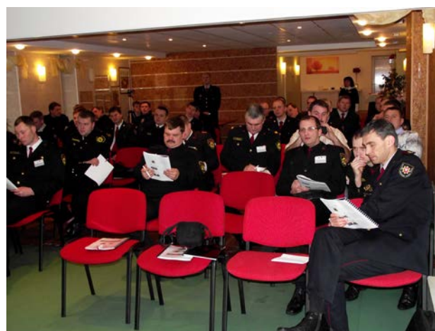
Seminārs Paņevezā 25.01.2011.