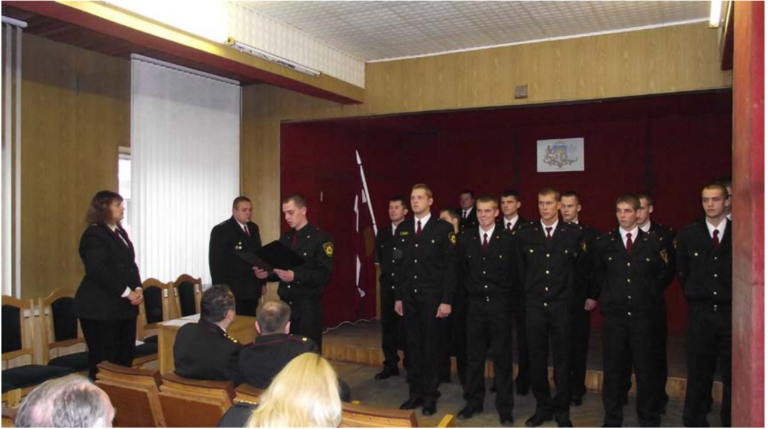
17.11.2010. Zvēresta došana.