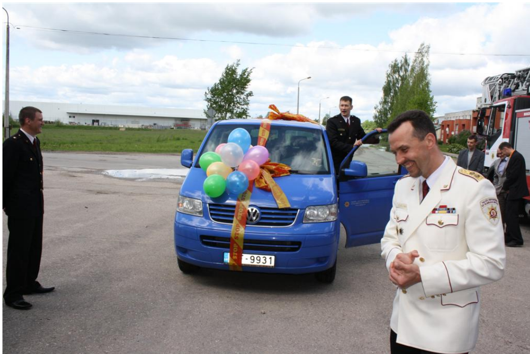
18.05.2012. Lūk arī pats auto.

Zemgales reģiona brigādes amatpersonas organizē un arī ar personīgo piemēru parāda padotajiem, kā jāstartē ugunsdzēsēju sporta sacensībās.