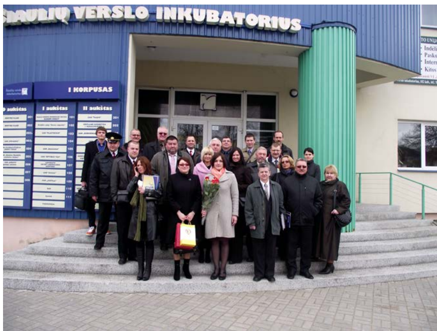
Semināra dalībnieki Šauļos