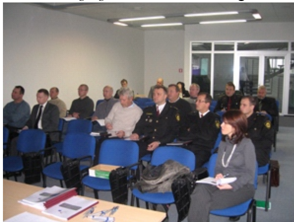
Seminārs Jelgavā.