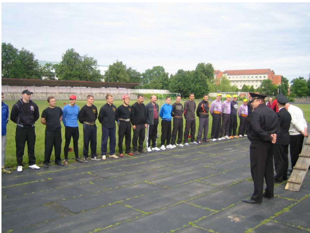
17.06.2010 Zemgales reģiona brigādes ugunsdzēsības sporta sacensību atklāšana Dobelē.