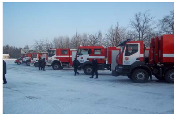
Projekta ietvaros iegādātās tehnikas demonstrēšana