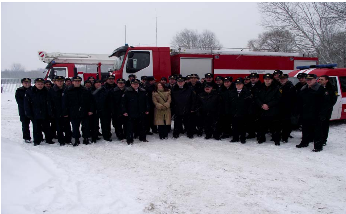
Paņevezas un Zemgales reģiona brigādes kolēģi seminārā Paņevezā 2011.gada 24.janvārī.