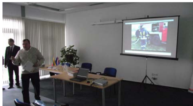
Seminārs Jelgavā