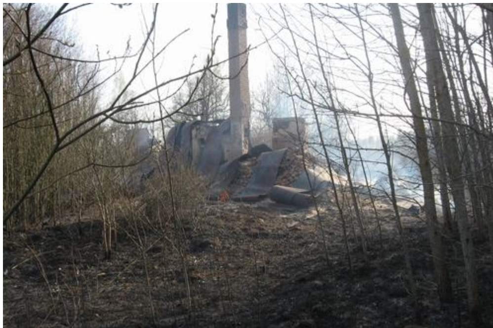
“Sila Pinči” ugunsgrēkā nodega pilnībā

Kopumā izdega kūlas lauks 15 hektāru platībā, un uguns iekļuva arī tuvējā mežiņā. Liesmas apslāpēt palīdzēja Valsts meža dienesta darbinieki. Toties neapdzīvotā 60 kvadrātmetru lielā māja “Sila Pinči” nodega pilnībā.