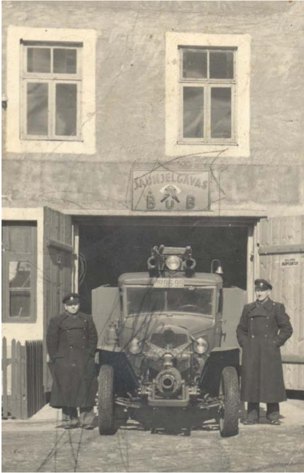
Jaunjelgavas depo 1947.gads