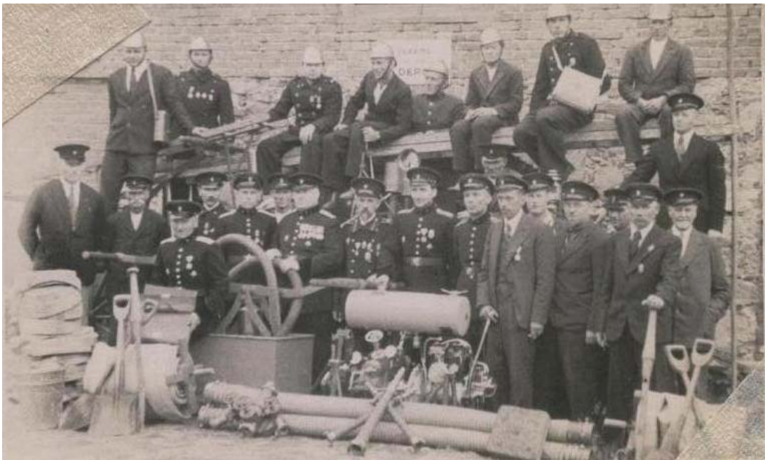
Plaviņu brīvprātīgo ugunsdzēsēju biedrības biedri

Ēka Daugavas ielā 26 būvēta ievērojami agrāk, vēlāk tā tika piemērota ugunsdzēsības komandas izvietojšanai. Sākumā komandas rīcībā bija smagās automašīnas ar motorsūkņiem.