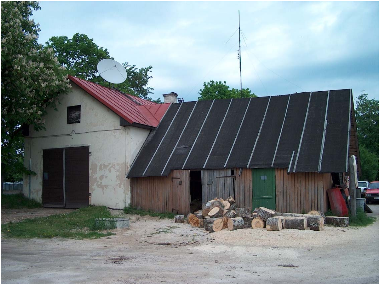
Struktūrvienības ēka Daugavas ielā 26, Pļaviņās