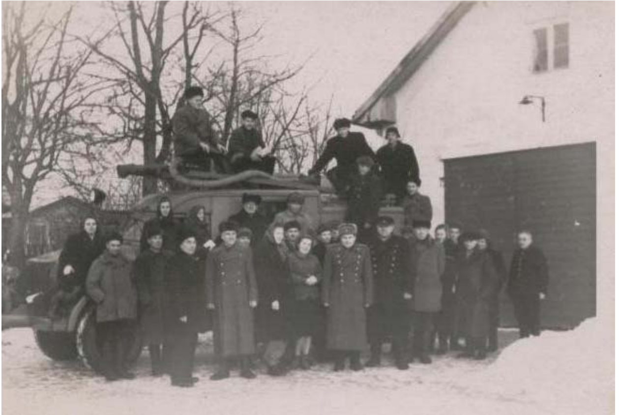
Plaviņu brīvprātīgo ugunsdzēsēju biedrības komanda pie ugunsdzēsības depo Daugavas ielā 26