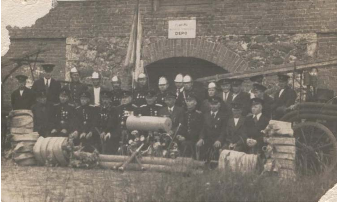
Plaviņu brīvprātīgo ugunsdzēsēju biedrības biedri pie depo