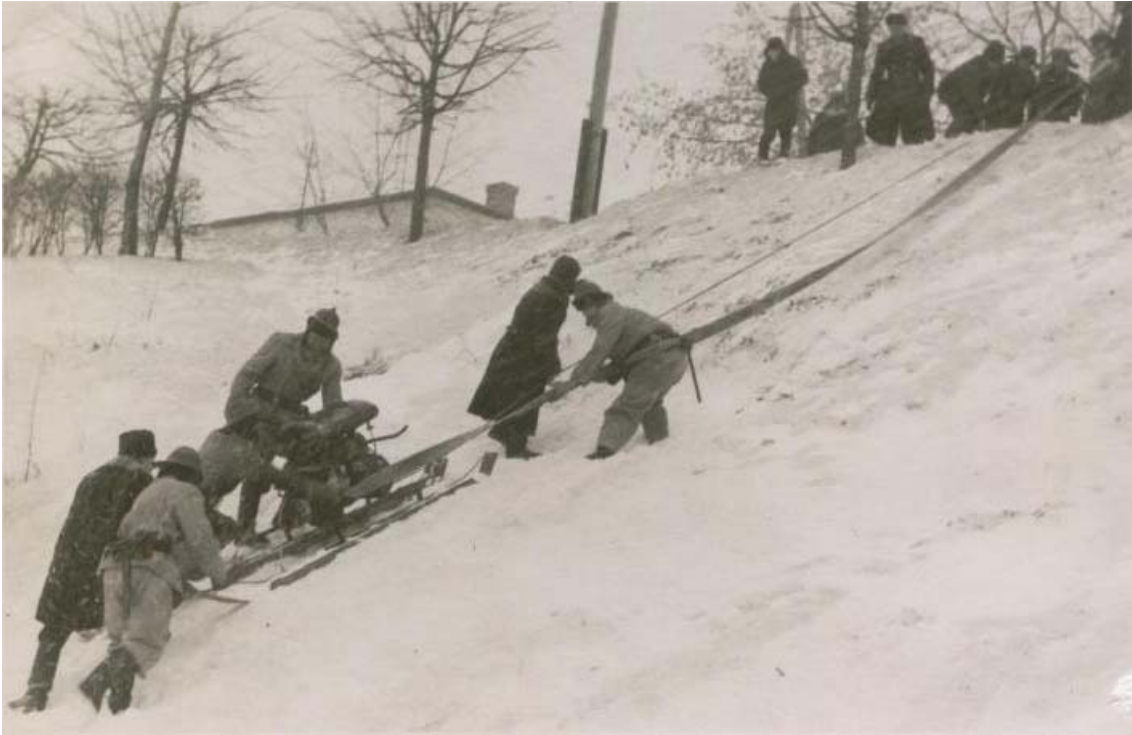
Nodarbības ar motorsūkni