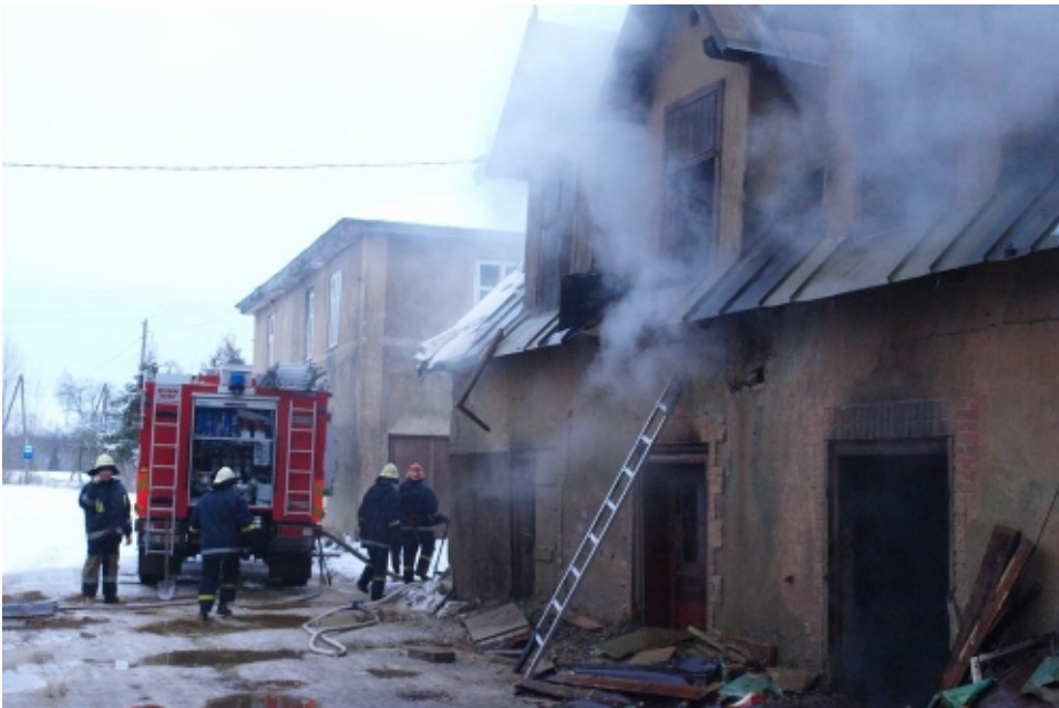
Ēka izdega gandrīz pilnībā. ( 11.01.2012.)

2012.gada 11.janvāra rītā Kokneses novada Bebru pagasta Jaunbebros, Reciju dzirnavās, notika traģisks ugunsgrēks, kurā gāja bojā 1924. gadā dzimusi sieviete. Izsaukums saņemts pulksten 4.55 rītā. Uz notikuma vietu izbrauca ugunsdzēsēji no Aizkraukles un Pļaviņām. Dzēšanas darbus apgrūtināja tas, ka mājas mansards bija piekrauts ar mantām un ēka ir avārijas stāvoklī, kas var apdraudēt pašus ugunsdzēsējus.