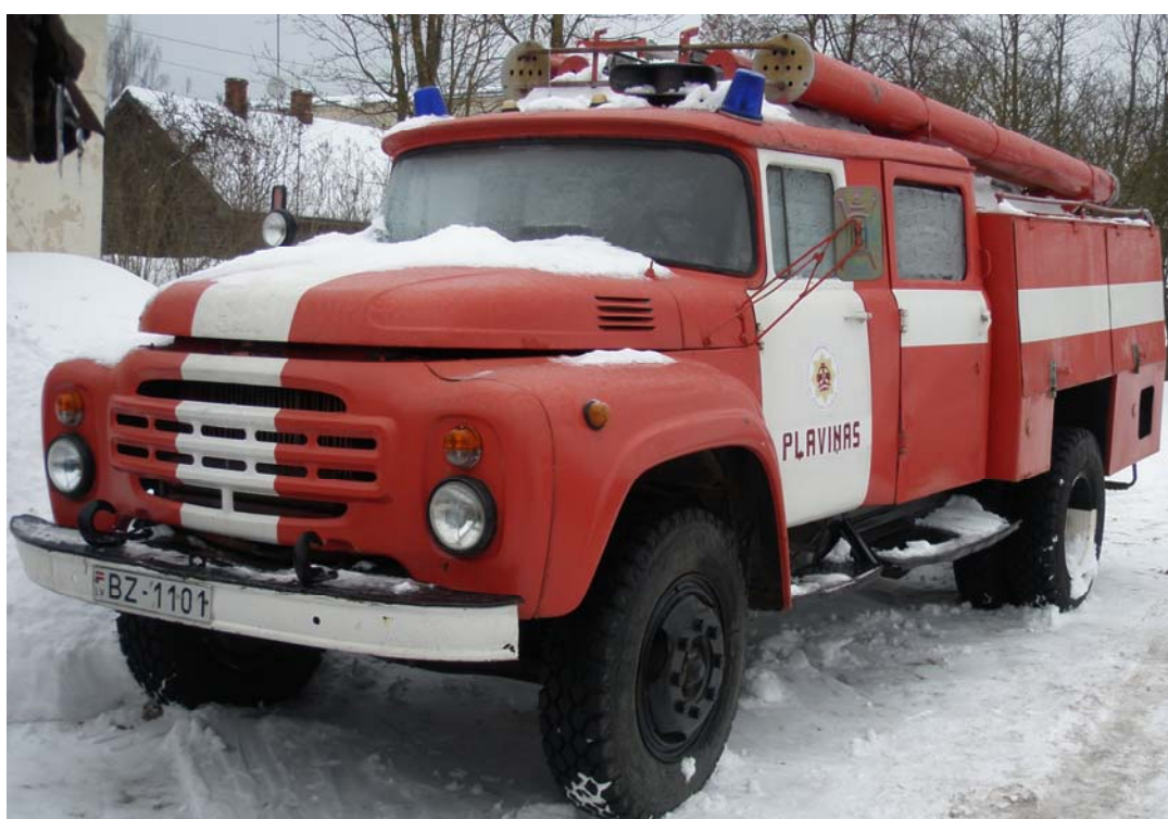
Zil-130 AC 40, 1992. gada