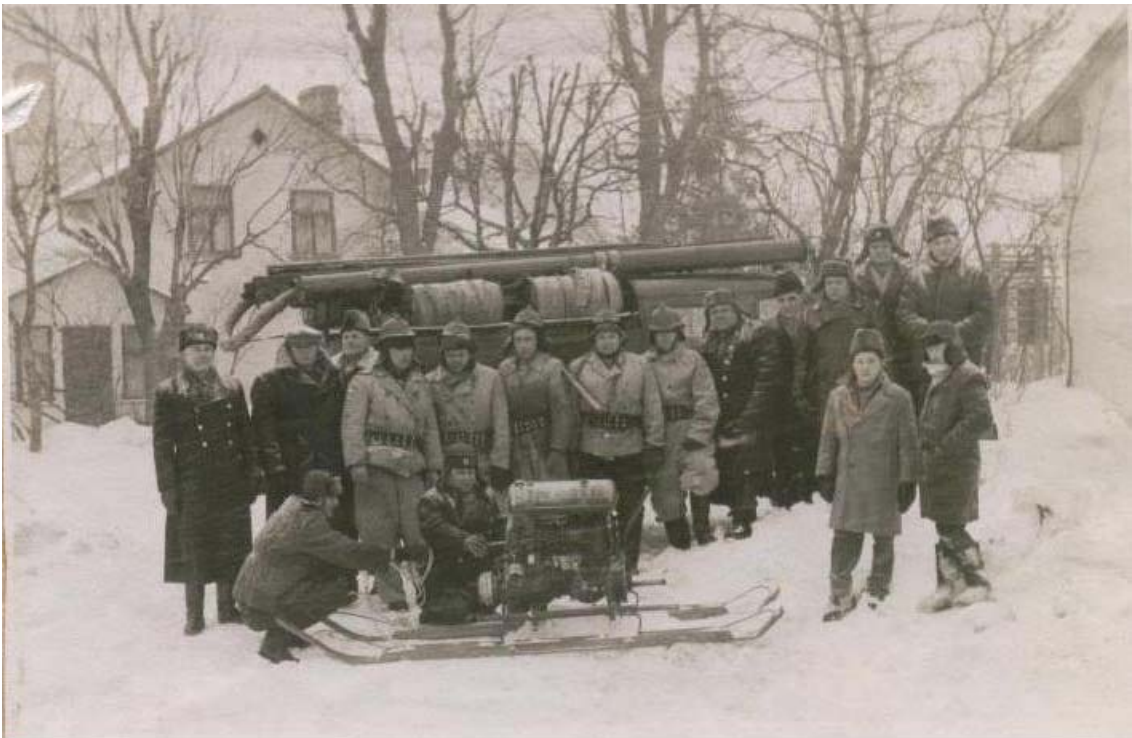
Pļaviņu brīvprātīgo ugunsdzēsēju biedrības komanda pie ugunsdzēsības depo Daugavas ielā 26