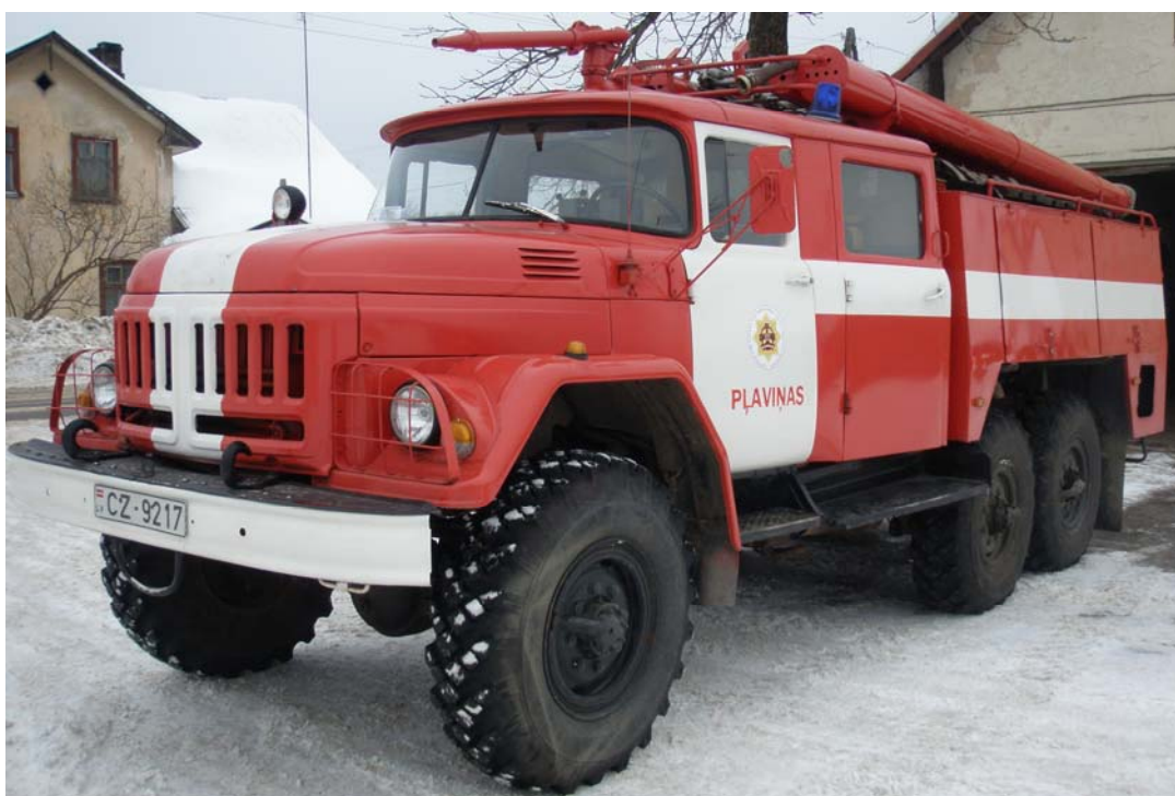
Zil-131 AC 40, 1997.gada

2012.gada septembrī Pļaviņu postenī atrodas šāda auto tehnika: