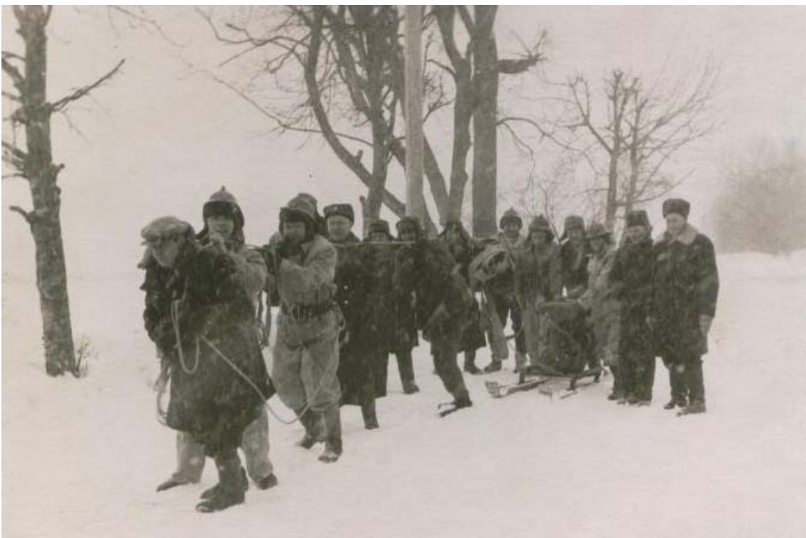
Nodarbības ar motorsūkni