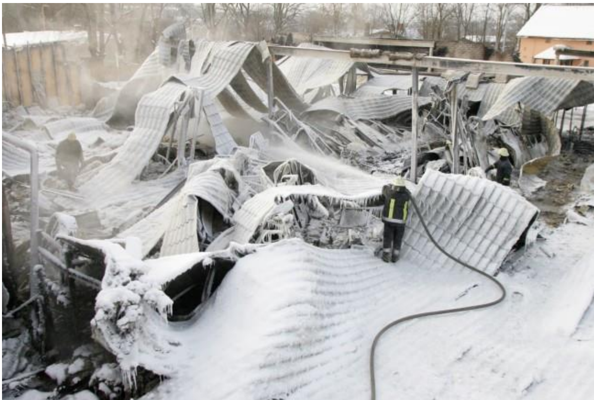
2010.gada 28.javāris ugunsgrēka dzēšana T/C "Globuss", Raiņa ielā 26/28, Cēsīs turpinās.