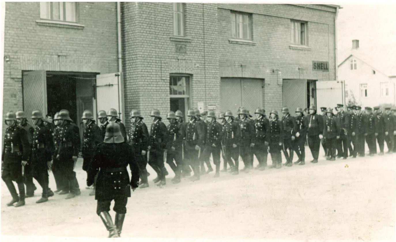
1930.gadi Cēsu ugunsdzēsēji pie depo ēkas Valmiera iela 1, Cēsis