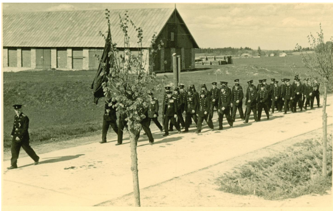
1920.-30. gadi Cēsu ugunsdzēsēji svinīgā gājienā Cēsīs.