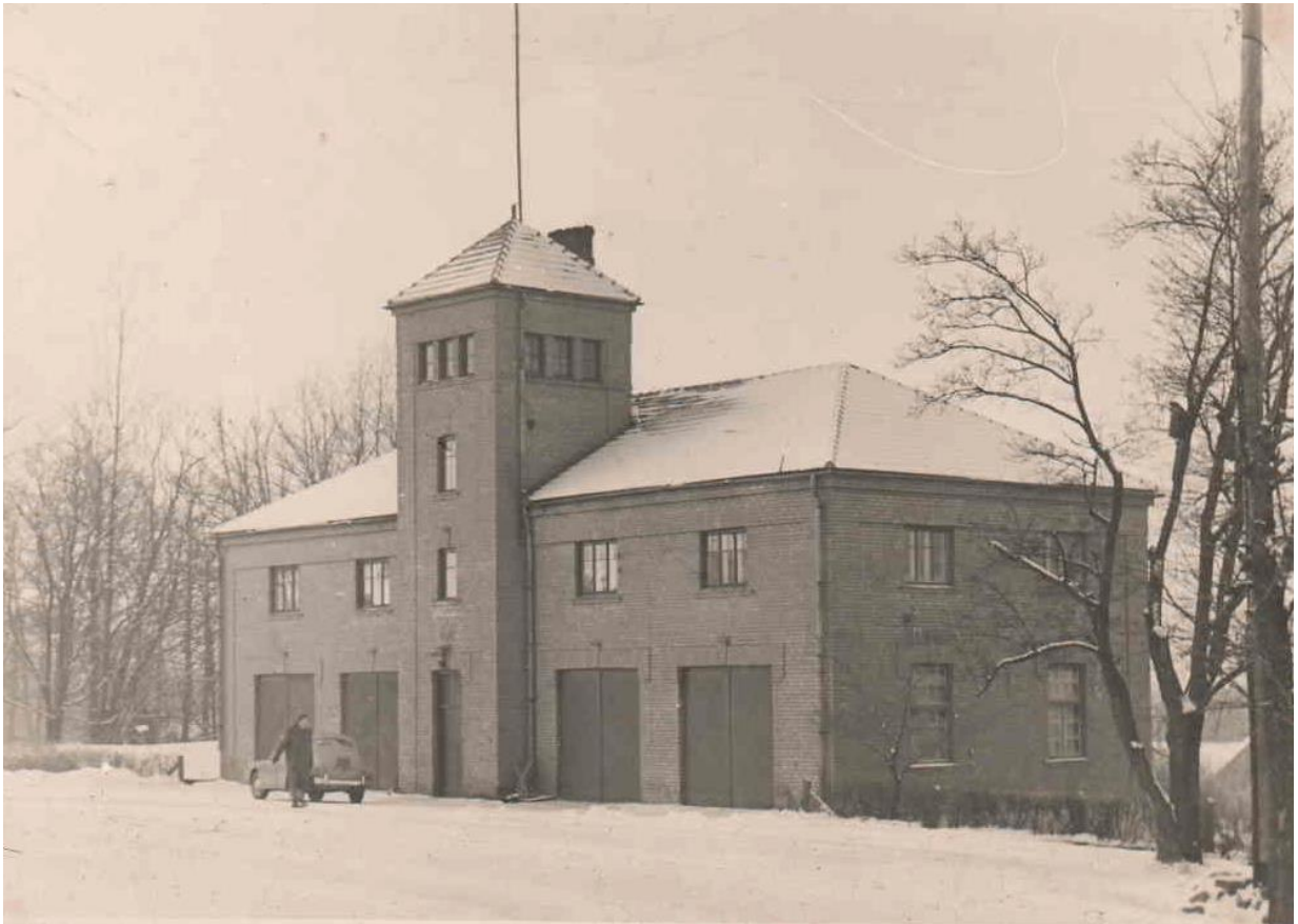
1932.gadā būvētā ēka, kurā izvietots Cēsu ugunsdzēsēju depo. (Kurā Cēsu ugunsdzēsēji mitinājās līdz pat 2014.gada nogalei)