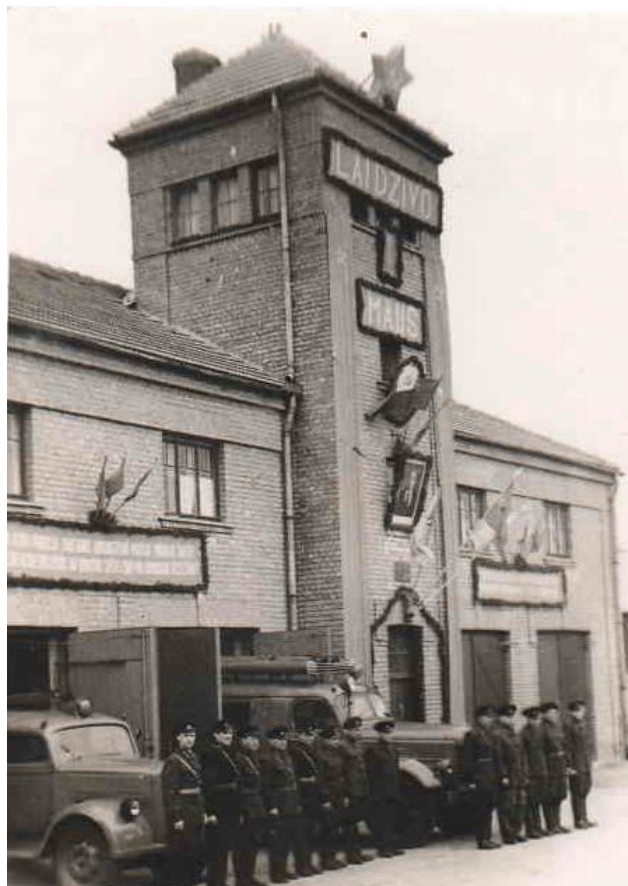
Ap 50.gadu vidu Maija svētki Cēsu depo.