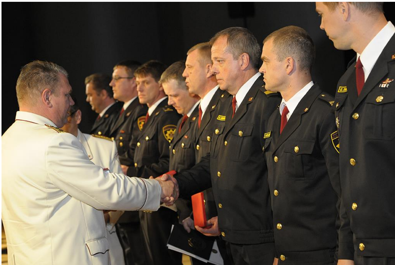
2015.gada 13.maijā VUGD VRB Cēsu daļas amatpersonas svinīgā pasākumā par godu Latvijas Ugunsdzēsības 150.gadadienai.