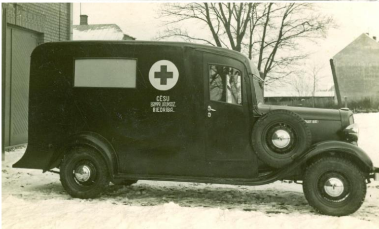
1930.gadi Cēsu BUB sanitārā mašīna.