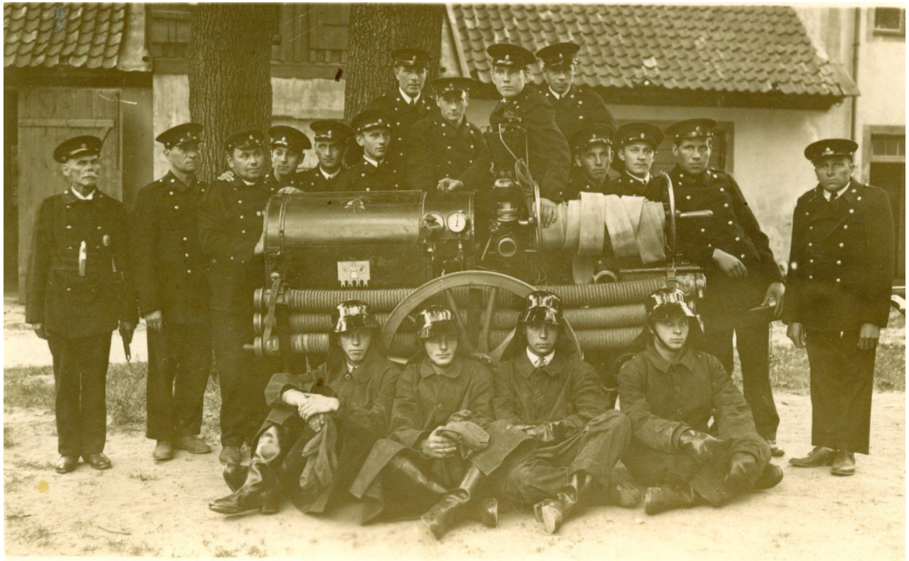
1920.-30. gadi Cēsu BUB komandas dalībnieki ar rokas velkamo sūkni.