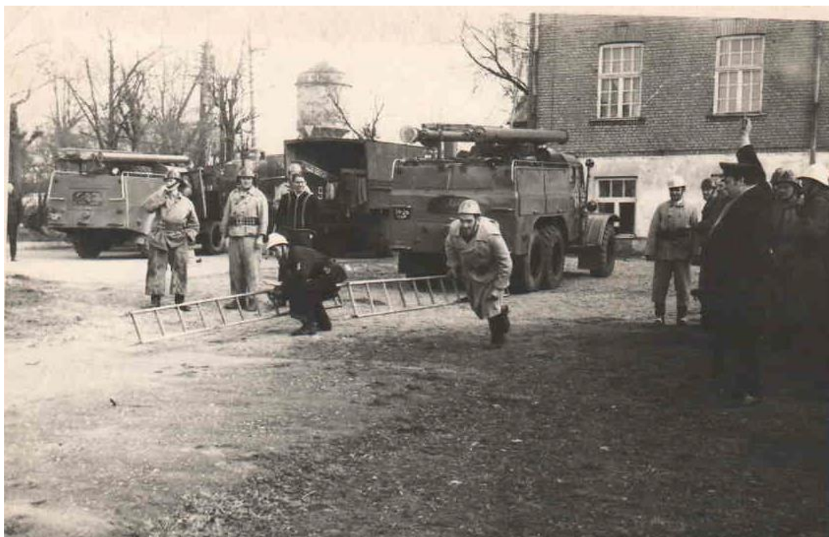
1974.gada 17.aprīlis Starpmaiņu sacensības aiz Cēsu depo ēkas (pagalmā).