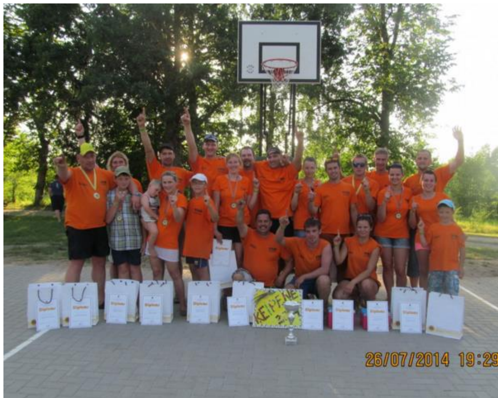
2014.gada 26.jūlijā Cēsu daļas komandas kop bilde iegūstot pirmo vietu, IX VUGD Ģimeņu sporta un atpūtas svētkos.