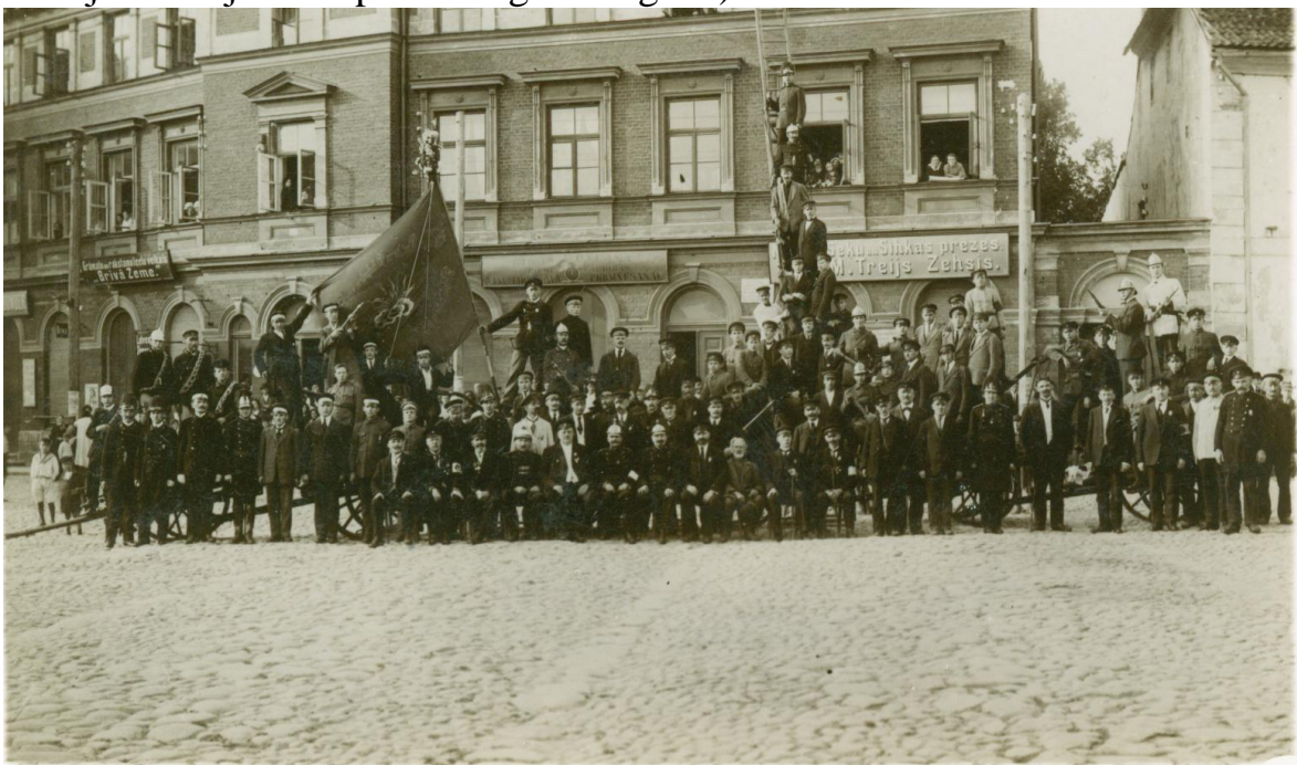
1932.gada 11.septembrī Cēsu BUB dalībnieki biedrības 65.gadu jubilejas svinību laikā, tirgus laukumā.