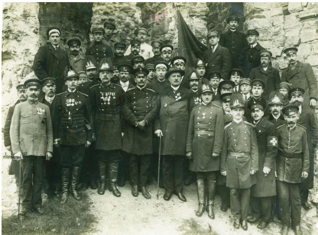
1867.gads Cēsu BUB 5 gadu jubileja.