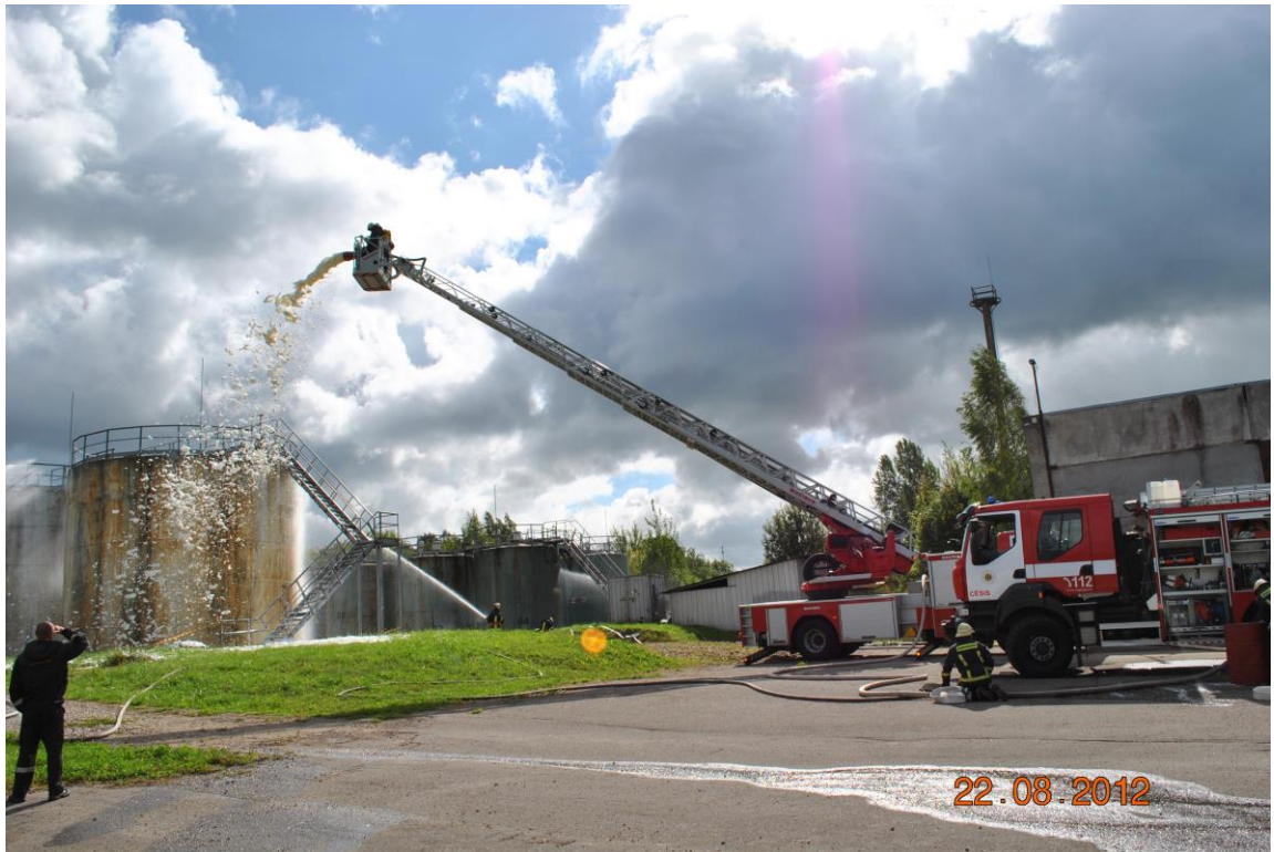
2012.gada 22.augusta taktiskā mācības SIA "East - West Transit" naftas bāzē, Birzes ielā 2, Cēsīs.