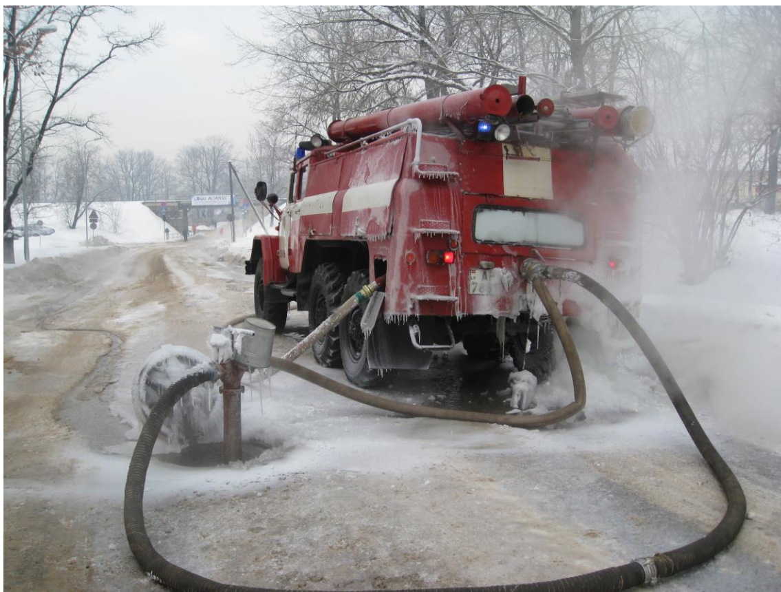
2010.gada 28.javāris ugunsdzēsības autocisterna ugunsgrēkā T/C "Globuss", Raiņa ielā 26/28, Cēsīs.