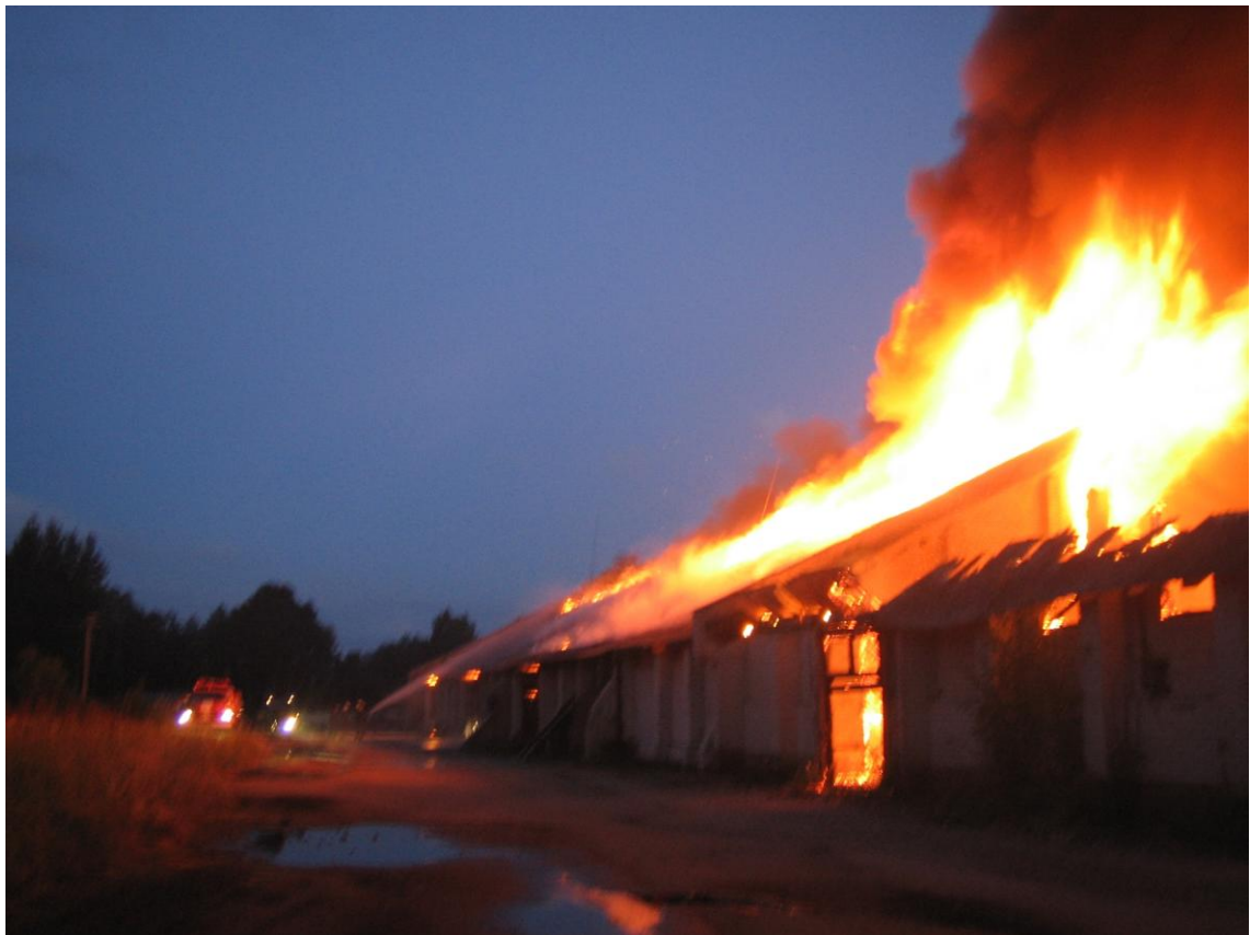
Ugunsgrēks pamestā Madonas kombikorma rūpnīcas graudu noliktavās. 2005. gada 3. jūlijā.