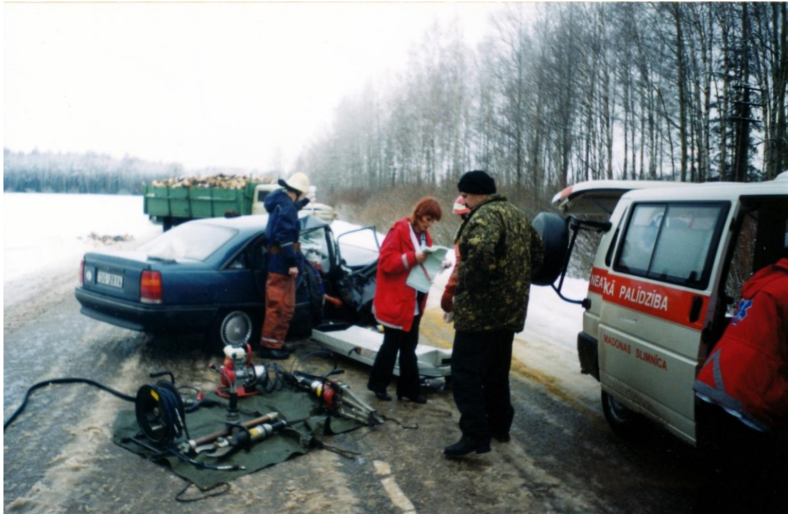
Ceļa negadījums Madona – Rēzekne 14 km. 2008. gada 29. novembrī