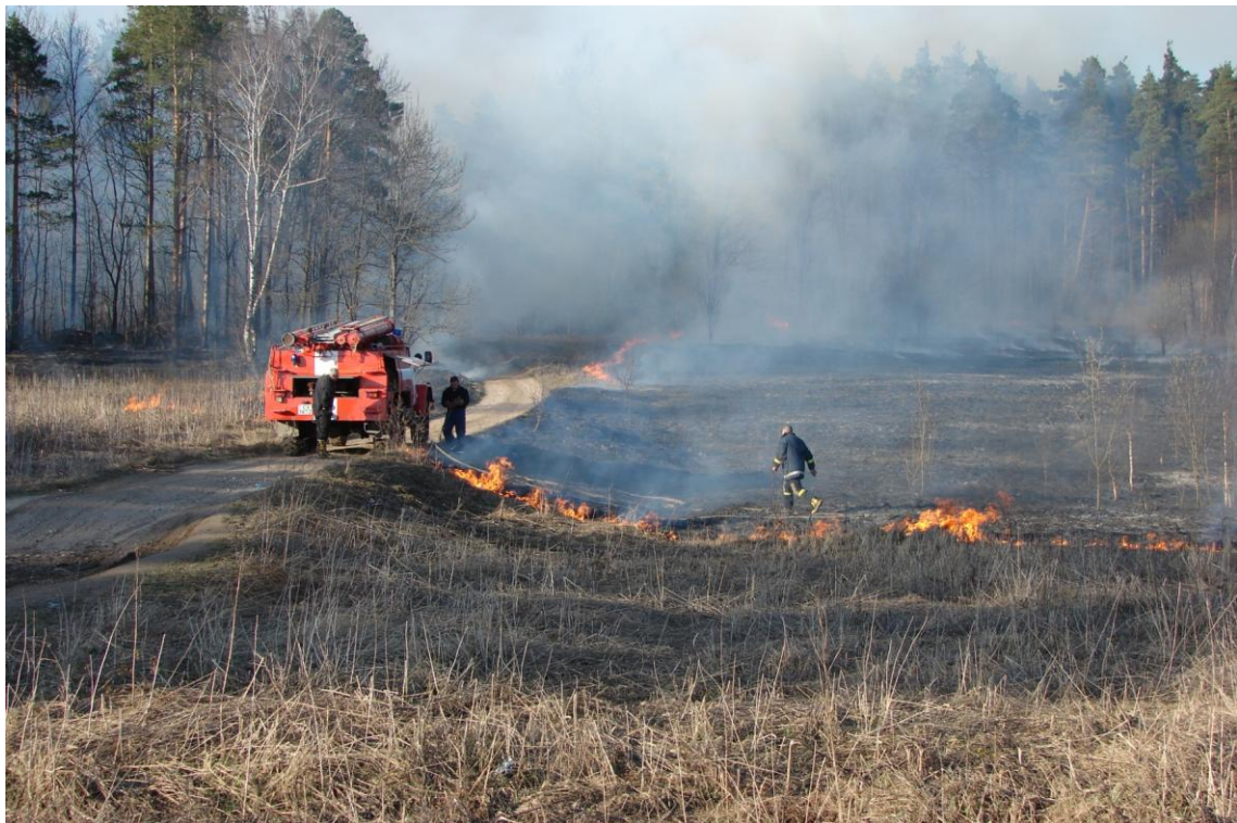
Kūlas dzēšana Madonas kartinga trasē. 2007. gada 28. martā