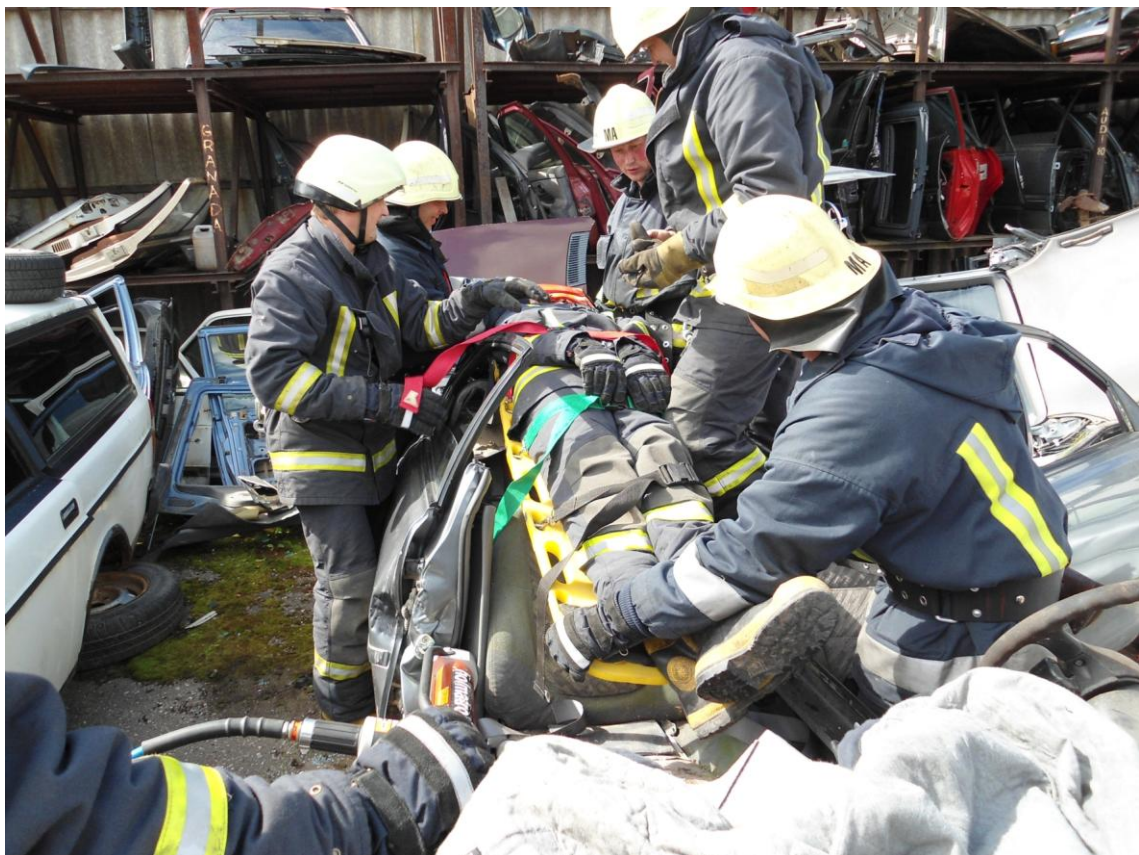
Praktiskās nodarbības ar hidrauliskajiem instrumentiem un cietušā izgriešana un izcelšana no avarējušās automašīnas. 2012. gads.