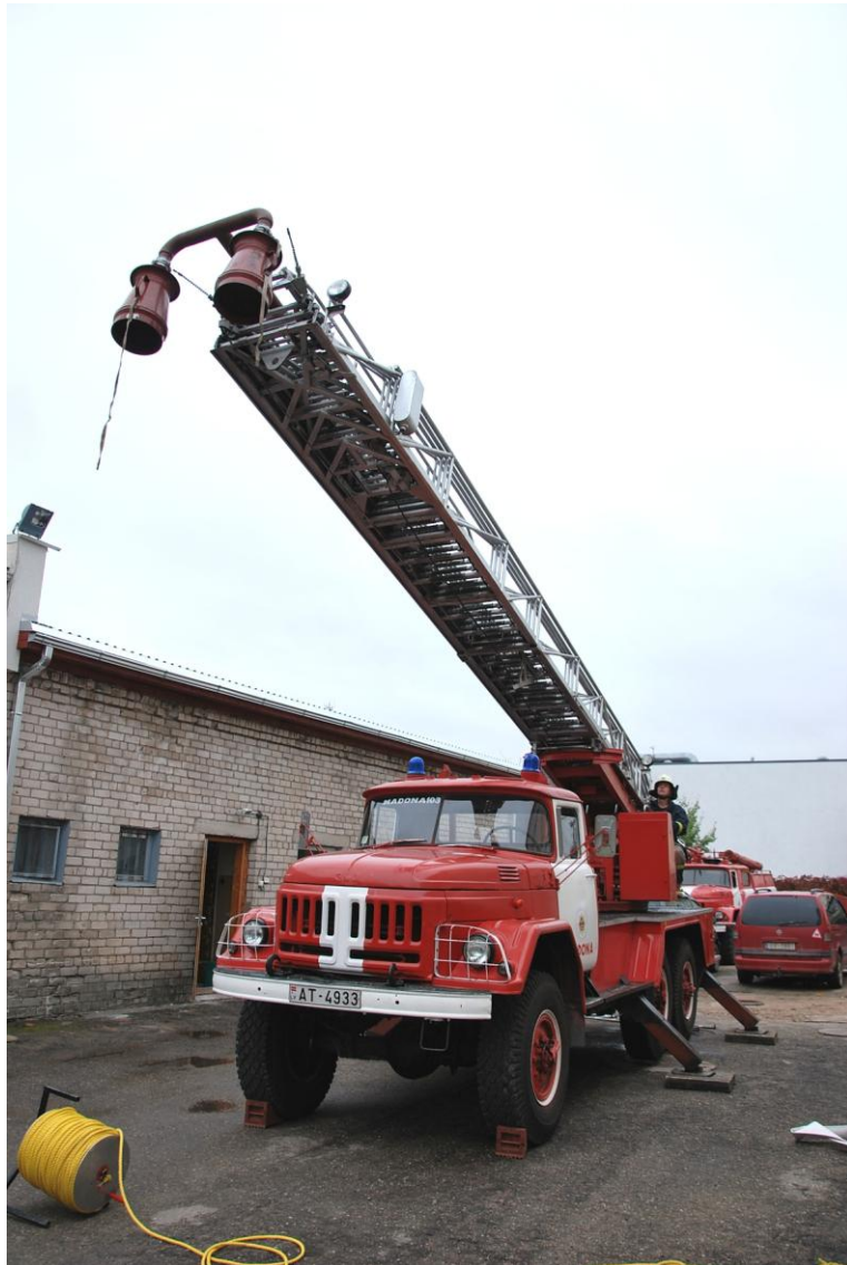
Autokāpnes uz ZIL -131 bāzes.