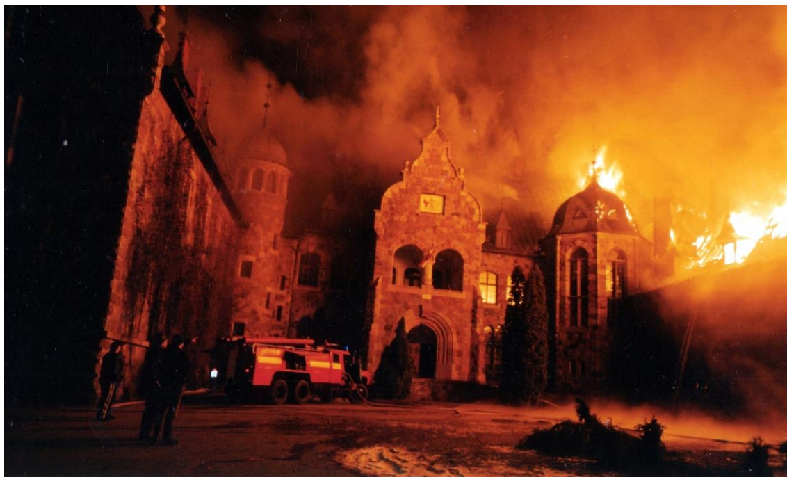
Ugunsgrēks Cesvaines pilī 2002. gadā 5. decembris plkst.06:30.