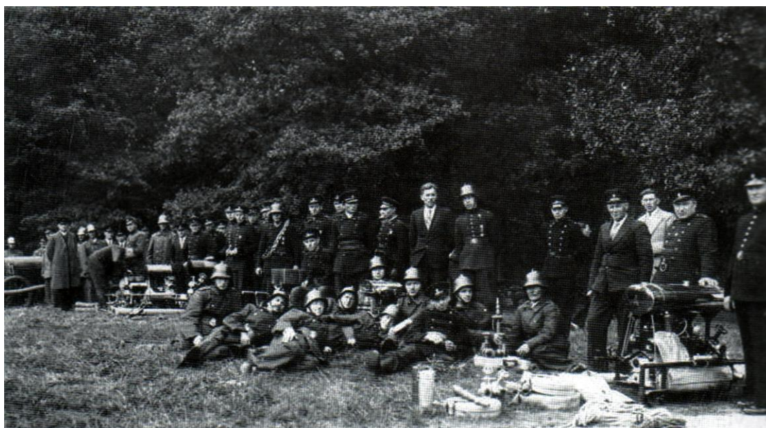
Komanda pie sūkņa. 20. gs. 30. gadi