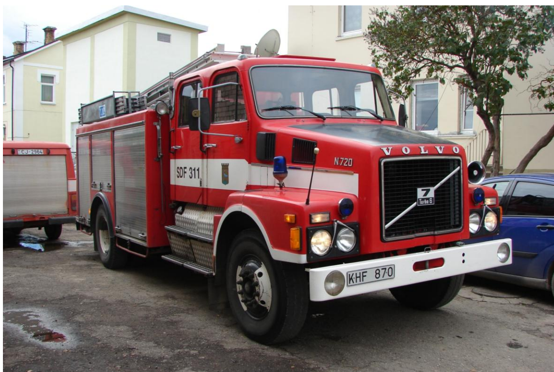
2007. gadā 11. oktobrī no Zviedrijas saņemam „VOLVO N720”