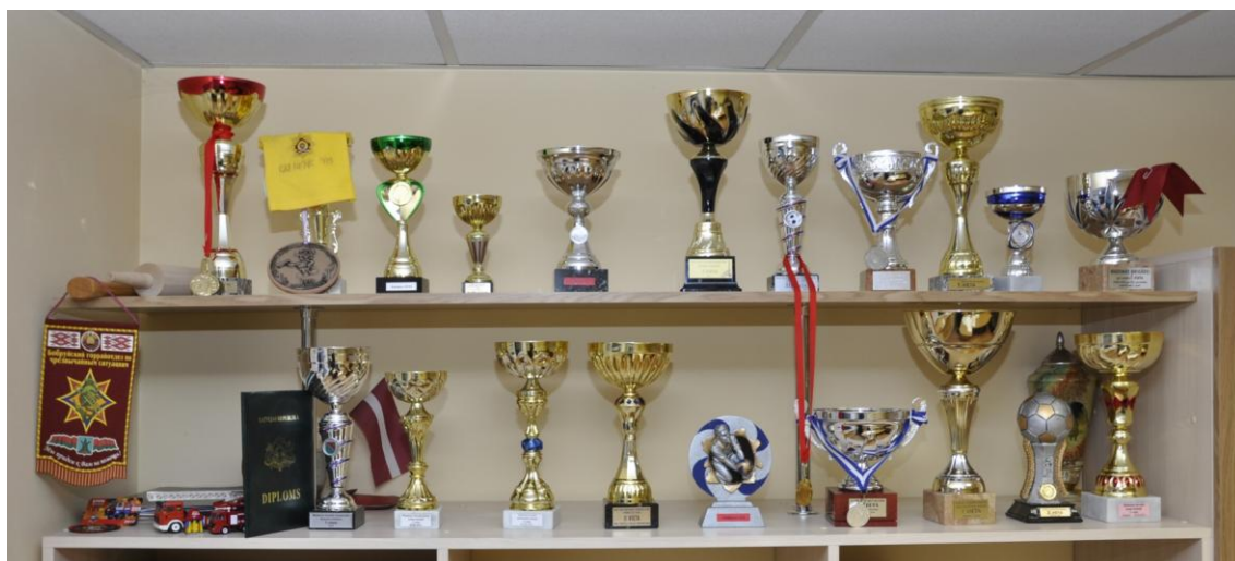
Madonas daļas sportā iegūtie kausi.