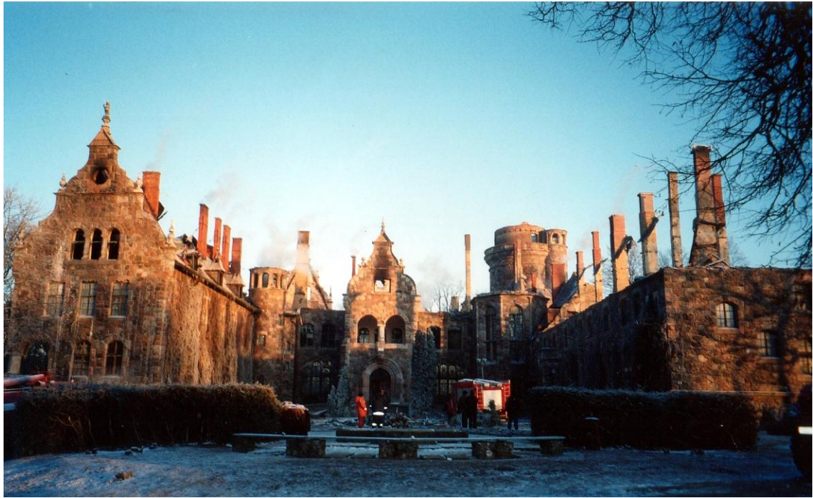
Cesvaines pils pēc ugunsgrēka. 2002. gadā 6. decembrī