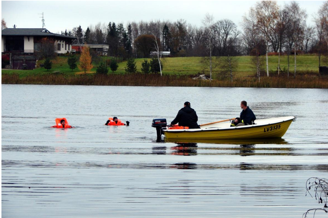
Praktiskās nodarbības uz ūdens Sala ezerā. 2012. gads