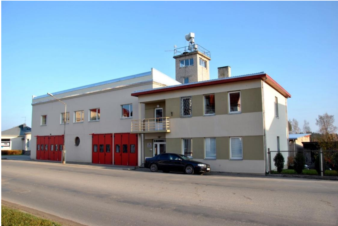
Madonas VUGD daļa 2014. gadā