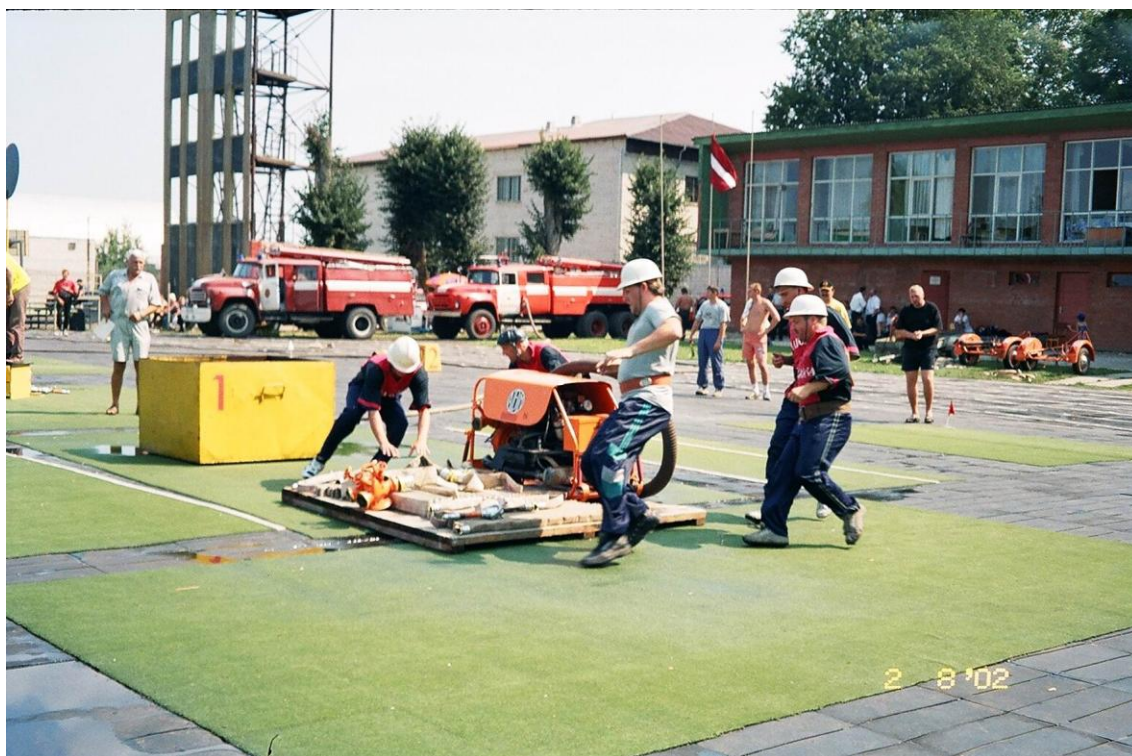
2002. gadā 2. augustā ugunsdzēsēju sacensības Kuldīgā.