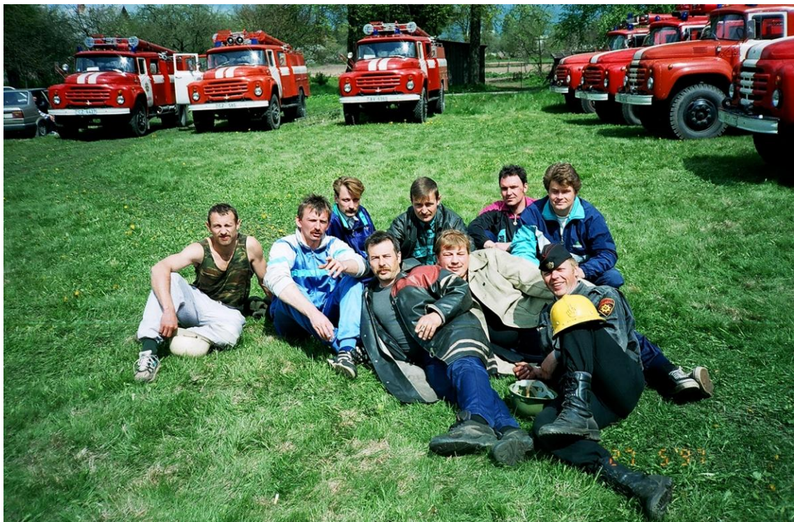
1997. gadā 27. maijā ugunsdzēsēju sacensības Alojā.