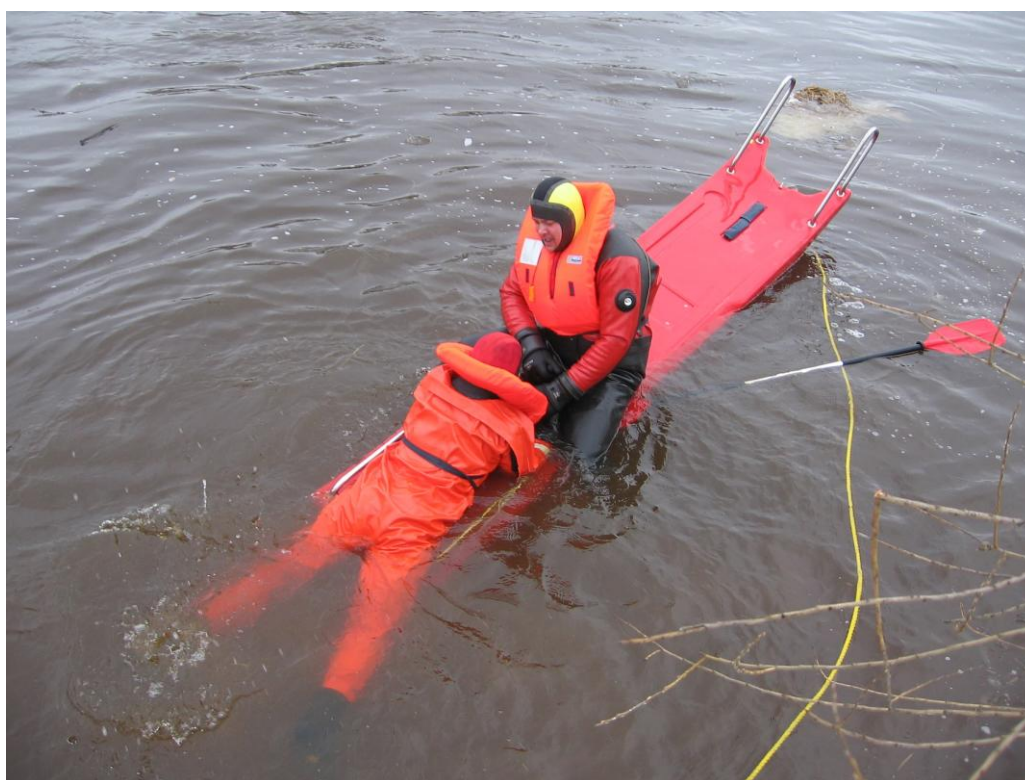
2012. gada marts. Nodarbības uz ūdens ar Hanza dēli.