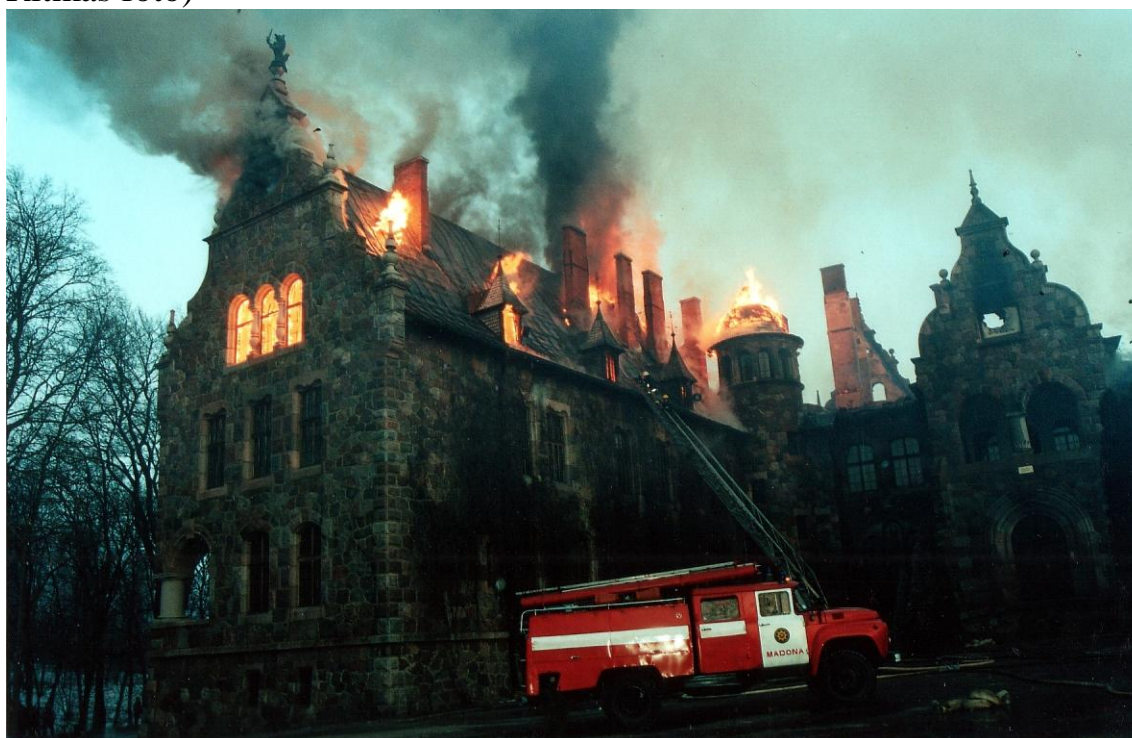
Ugunsgrēks Cesvaines pilī 2002. gadā 5. decembris plkst.10:10