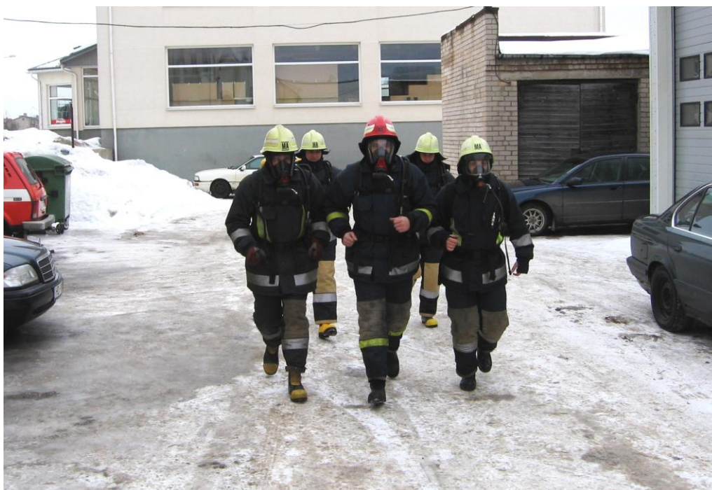
2012. gads 2. sardzes praktiskās nodarbības.