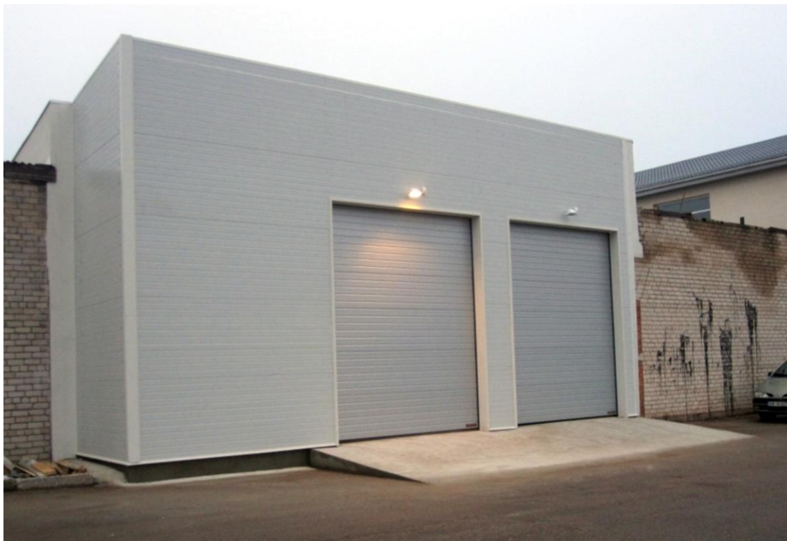
Jaunā garāža. 2012. gads

Madonas (Birži) 1921. gada pavasarī ieguva miesta tiesības. Pilsētā 1935. gadā bija 2357 iedzīvotāji. Kopš 1938. gada pilsētai ir savs ģerbonis.