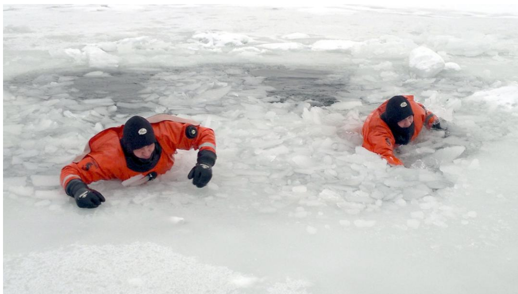
2012. gada 20. janvāris. Nodarbības uz ūdens.