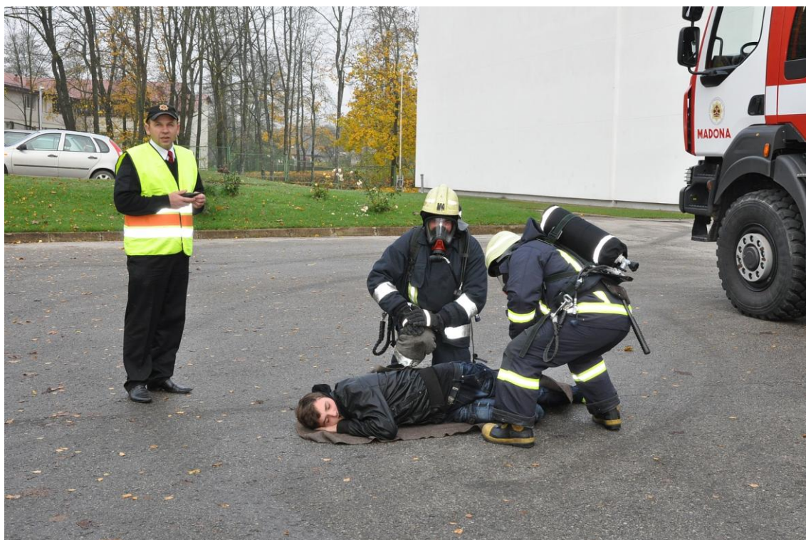
2012. gads oktobris. Garnizona mācības Madonas 2. vidusskolā