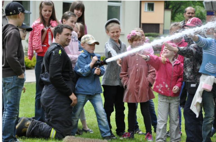
Bērnu ekskursija un ielūkošanās ugunsdzēsēju dzīvē. 2012. gads